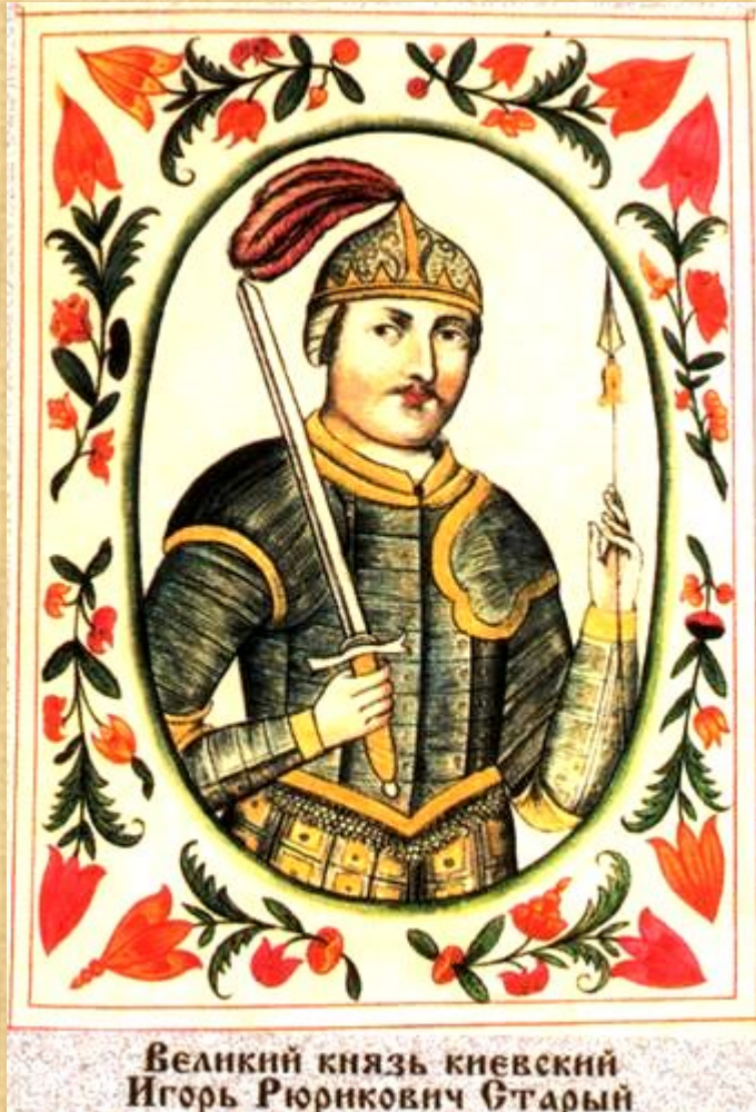
Великий князь киевский Игорь Рюрикович Старый