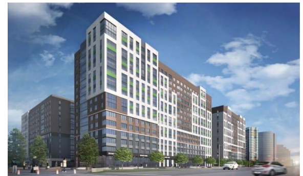
ЖК «ART. Город-парк» Год сдачи: 2019