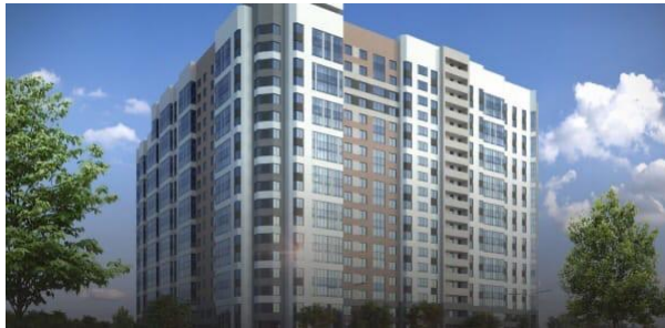
ЖК «Сахаров» Год сдачи: 2019

«Атомстройкомплекс» является компанией, изменившей облик Екатеринбурга. Это один из старейших застройщиков города, возводящей социальные, жилые и коммерческие объекты, стабильно входит в тройку лидеров по объему ввода и задает вектор развития строительной отрасли.