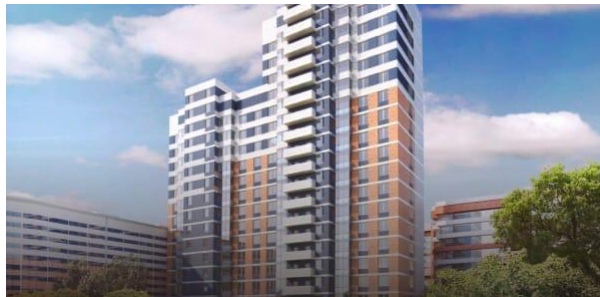
ЖК «Ударник» Год сдачи: 2019