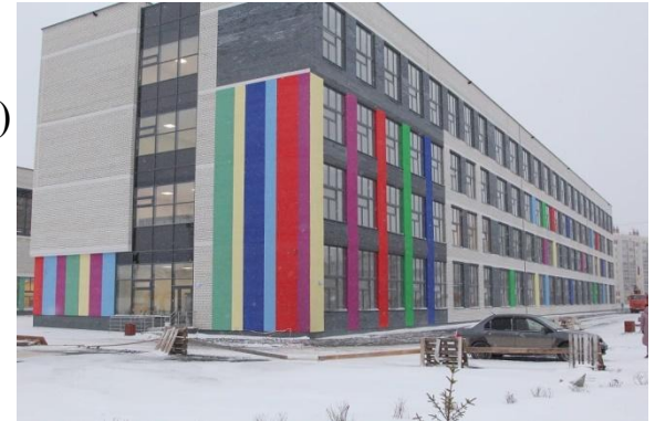
Школа №41 «Аксиома» (Каменск-Уральский)