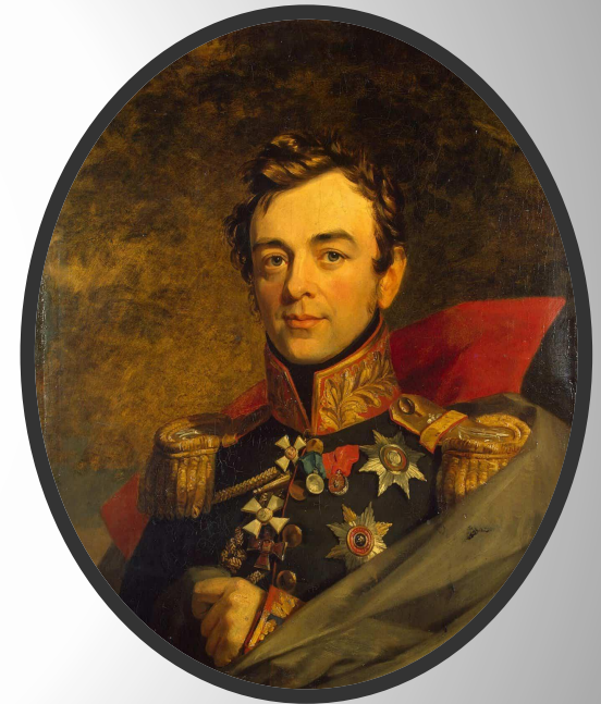
Иван Фёдорович Паскевич