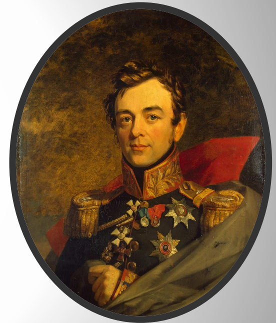
Иван Иванович Дибич- Забалканский