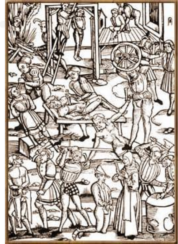
пытки, применяемые к обвиняемым в ереси