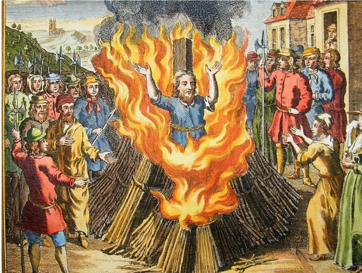
казнь на костре в период инквизиции