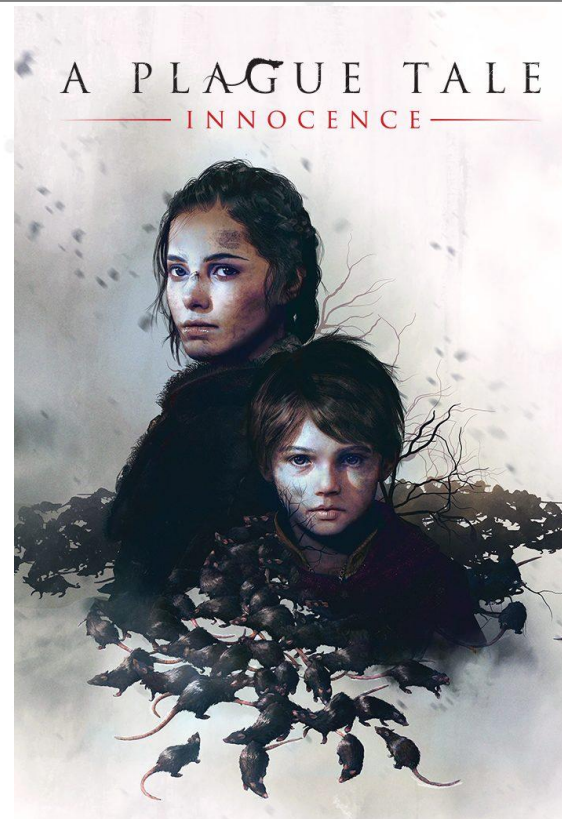
обложка игры «A Plague Tale. Innocence»