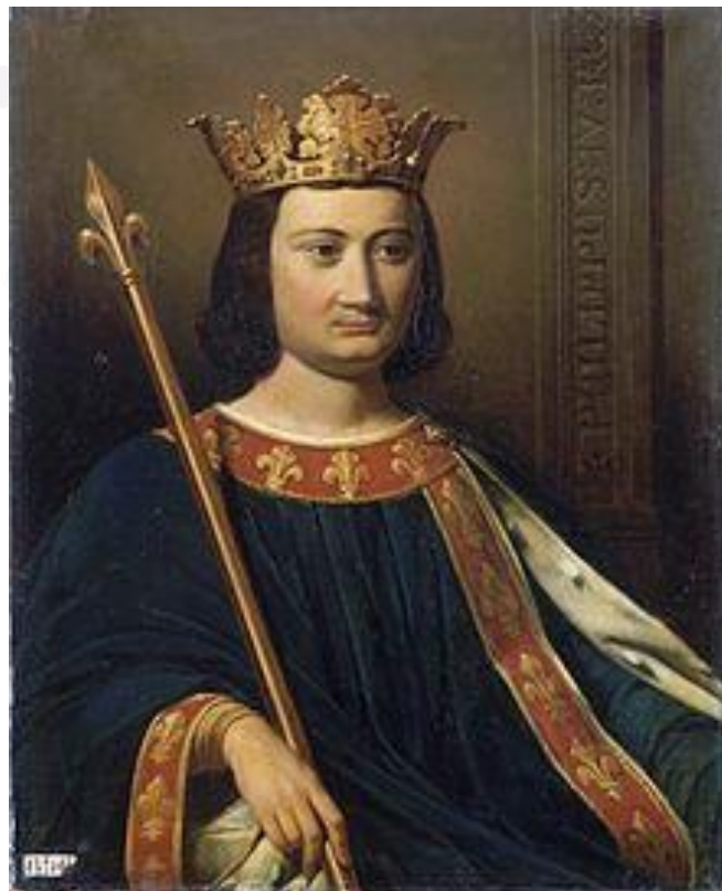
Король Франции Филипп IV Красивый