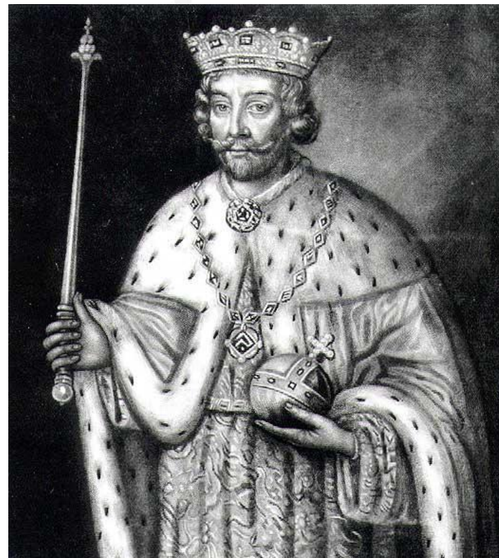
Король Англии Эдуард II