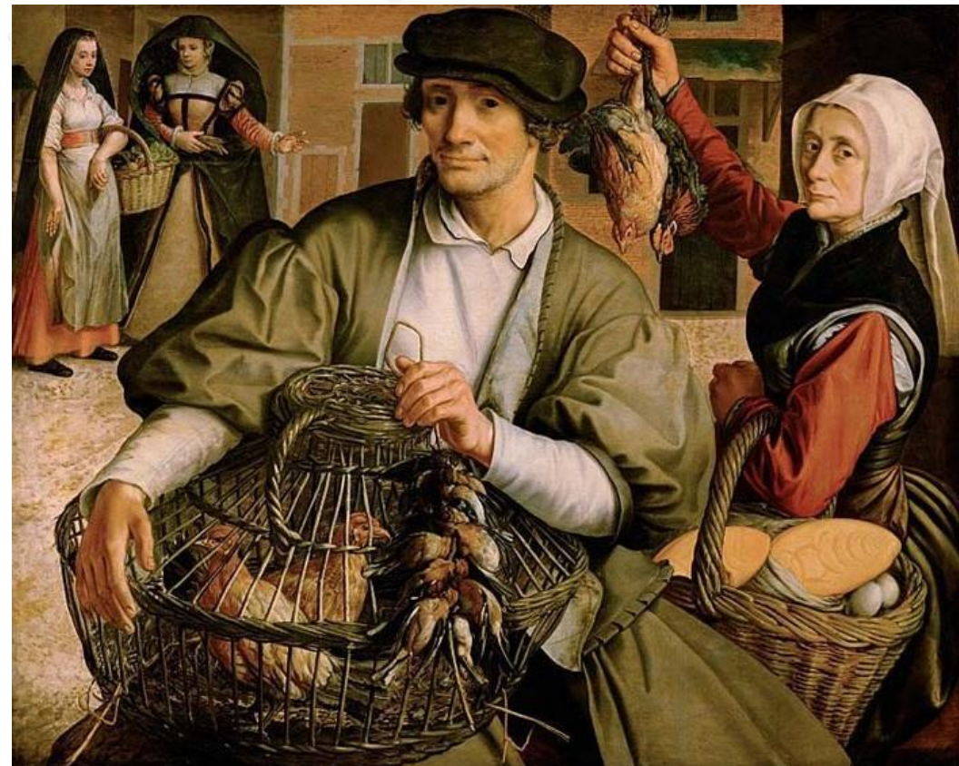
Европейские торговцы средневековья