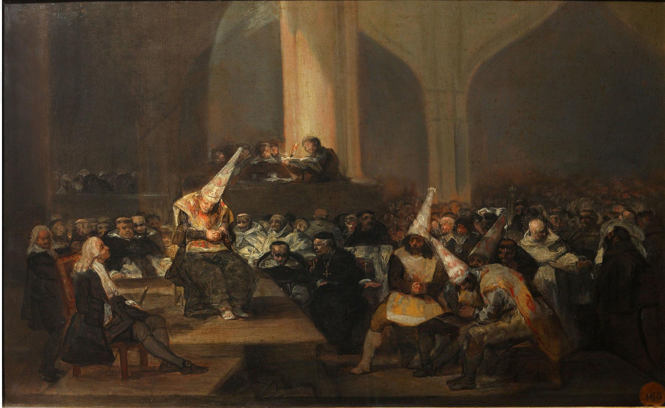
«Трибунал инквизиции», Ф. Гойя (1812—1819)