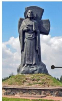
герб г. Турава