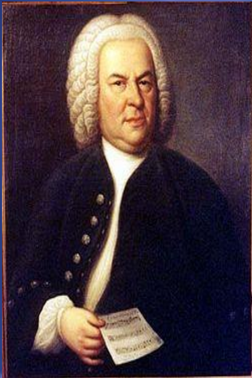
Иоганн Себастьян Бах 1685-1750