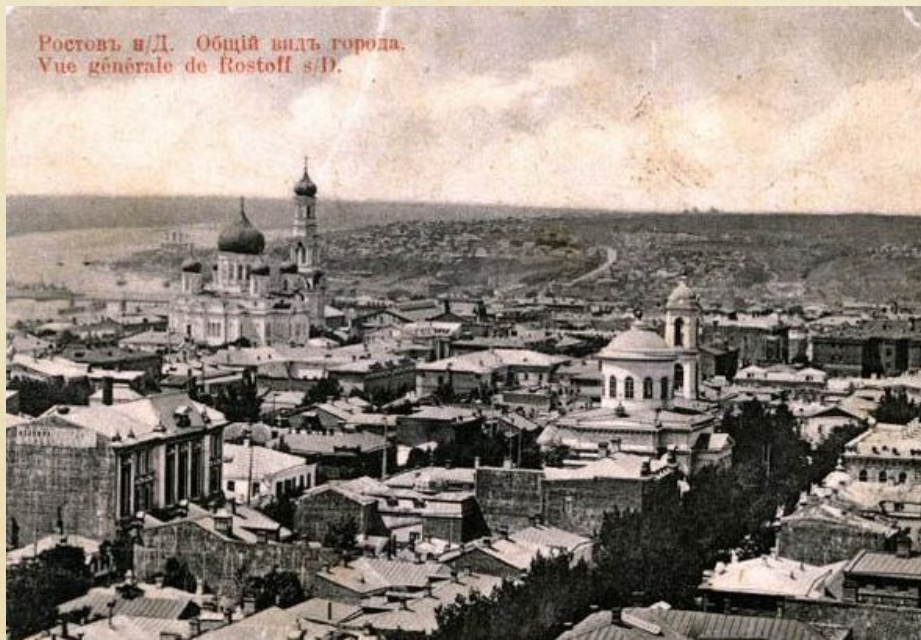
Ростов-на-Дону, 1924 г.