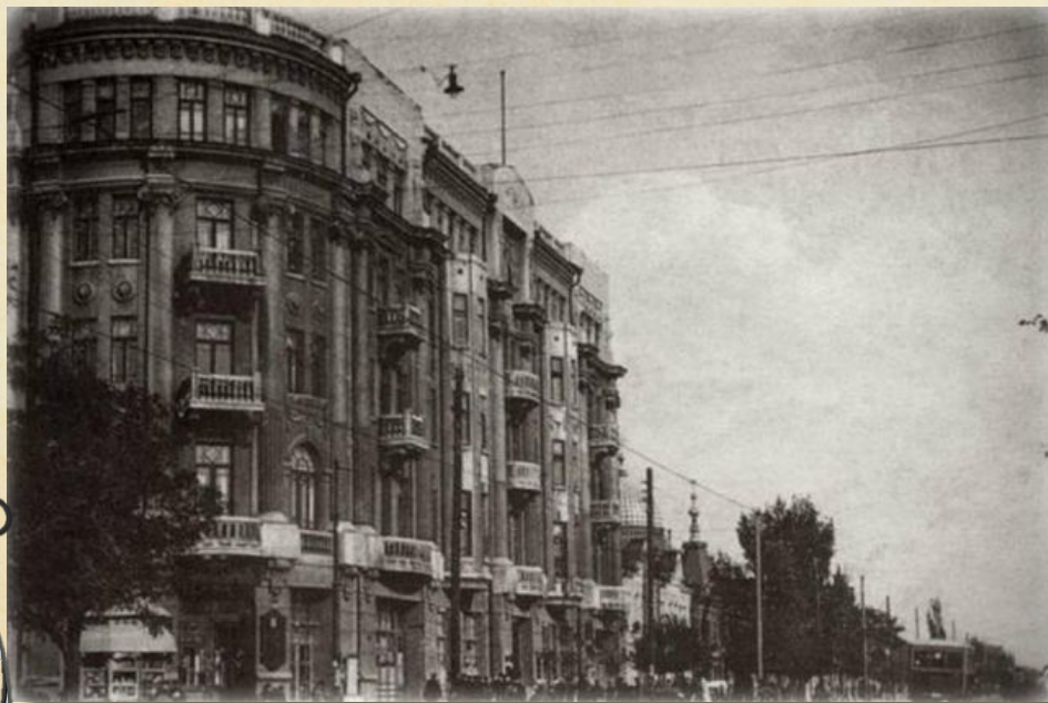
Ростовский университет, 1941 г.