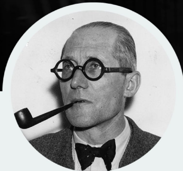
ЛЕ КОРБЮЗЬЕ ШВЕЙЦАРСКИЙ АРХИТЕКТОР

ЗНАМЕНИТОСТЬ: ИЗОБРАЖЕН ИЗВЕСТНЫЙ АРХИТЕКТОР ШВЕЙЦАРСКОГО ПРОИСХОЖДЕНИЯ ЛЕ КОРБЮЗЬЕ (1887-1965)