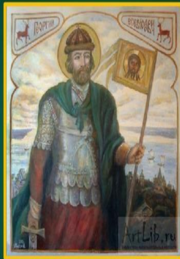
Великий князь Юрий Всеволодович

Наш город очень древний. Древний - это значит, что он возник очень давно. В 1221 году великий князь Юрий Всеволодович основал город Нижний Новгород.