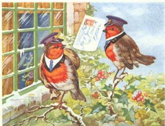
THE CHRISTMAS MORNING POST

В Англии малиновку рисуют на рождественских открытках, как у нас рисуют снегиря. Её красная грудка ярко выделяется на фоне белого снега.