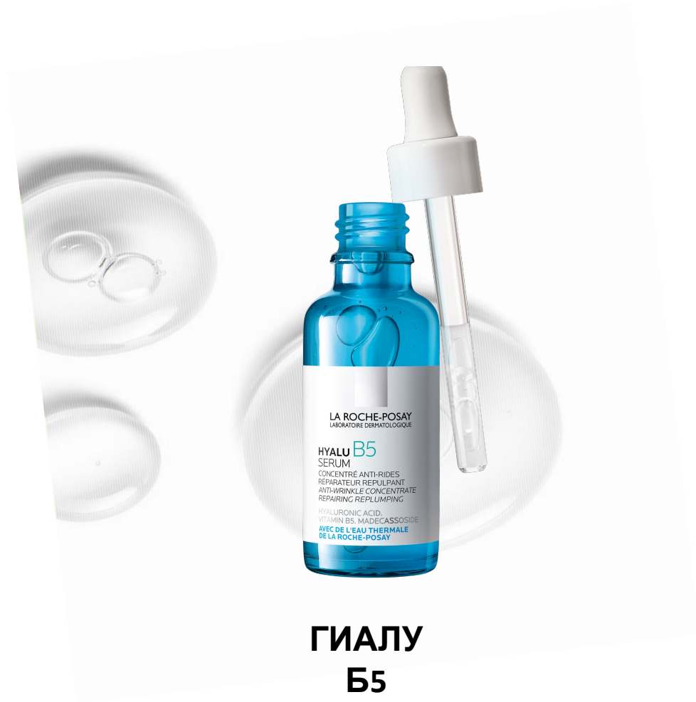
ГИАЛУ Б5 Сыворотка а