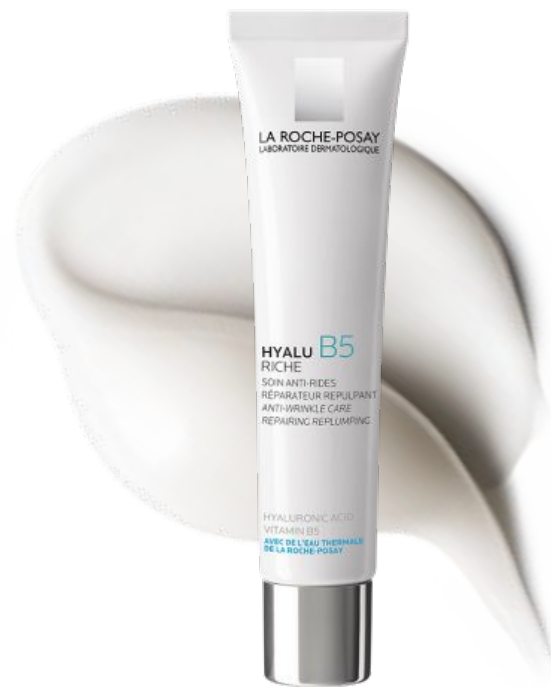
ГІАЛУ Б5 Крем