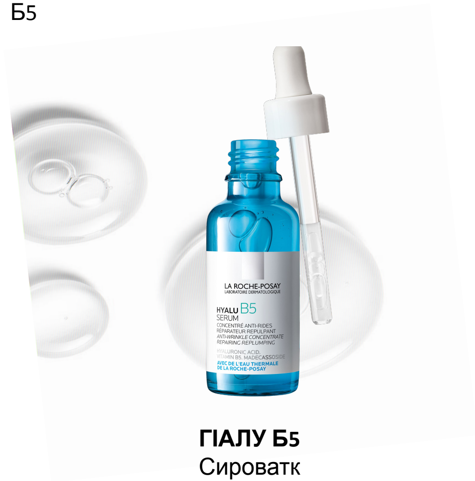
ГІАЛУ Б5 Сироватк а