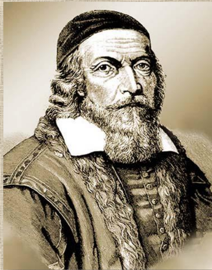
Ян Амос Коменский