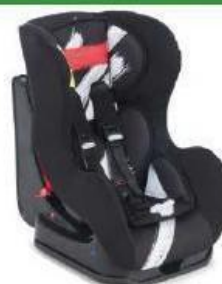
Автокресло группы I для детей массой 9-18 кг