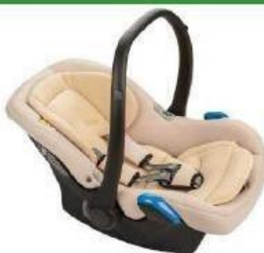
Автокресло группы 0+ для детей массой менее 13 кг