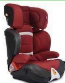
Автокресло группы III для детей массой 22-36 кг (возможно использование бустера)