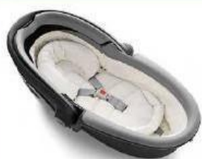
Автокресло «люлька» группы 0 для детей массой менее 10 кг

Детские удерживающие устройства подразделяют на 5 весовых групп: