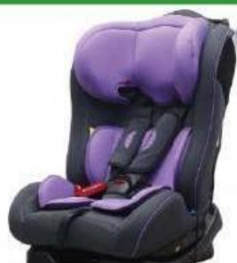
Автокресло группы II для детей массой 15-25 кг