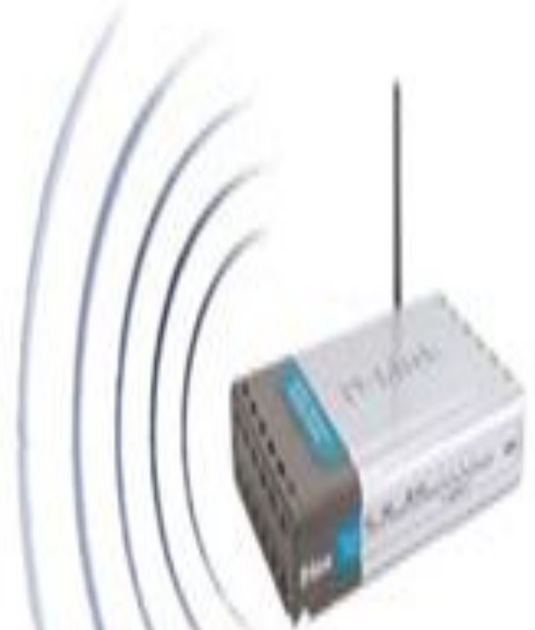
Точка доступа, подключенная в сеть