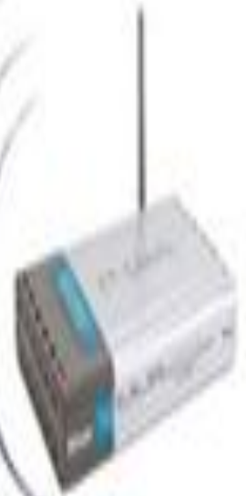
Точка доступа, подключенная в сеть