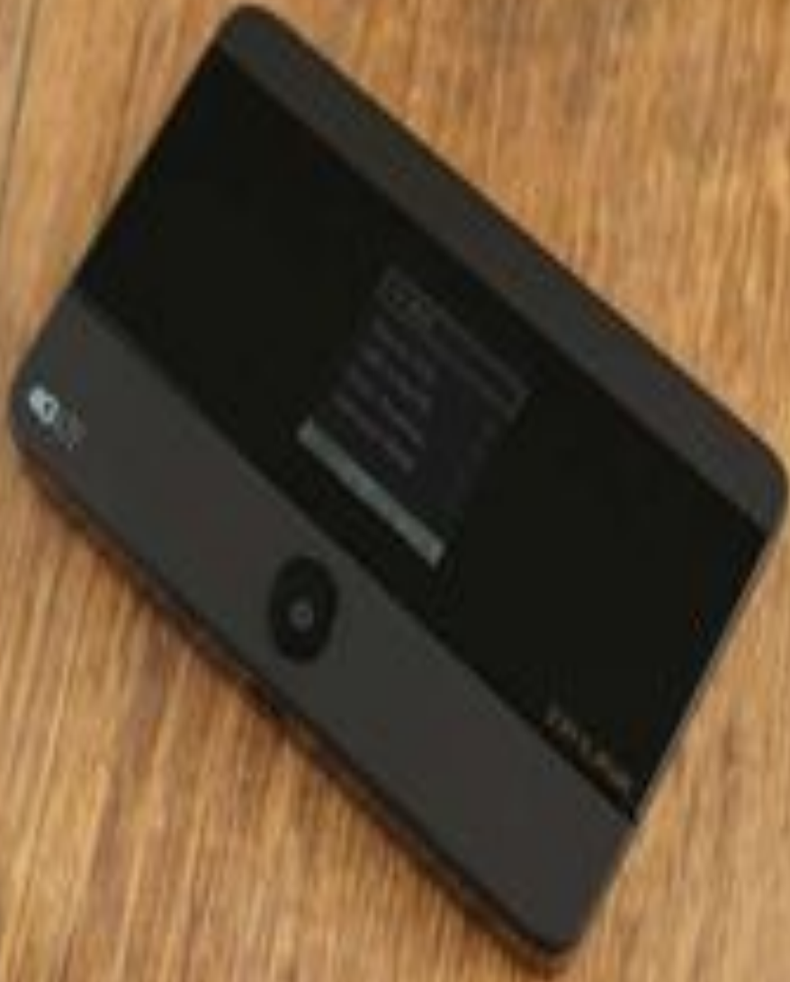
Рисунок 1.1 – внешний вид портативного маршрутизатора TP-Link M7350