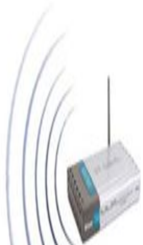
Точка доступа, подключённая в сеть