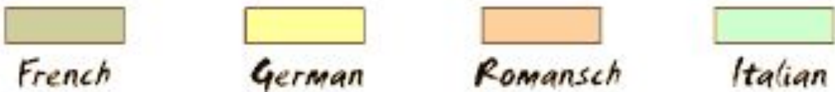
Languages Spoken in Switzerland (Approximate Boundaries)