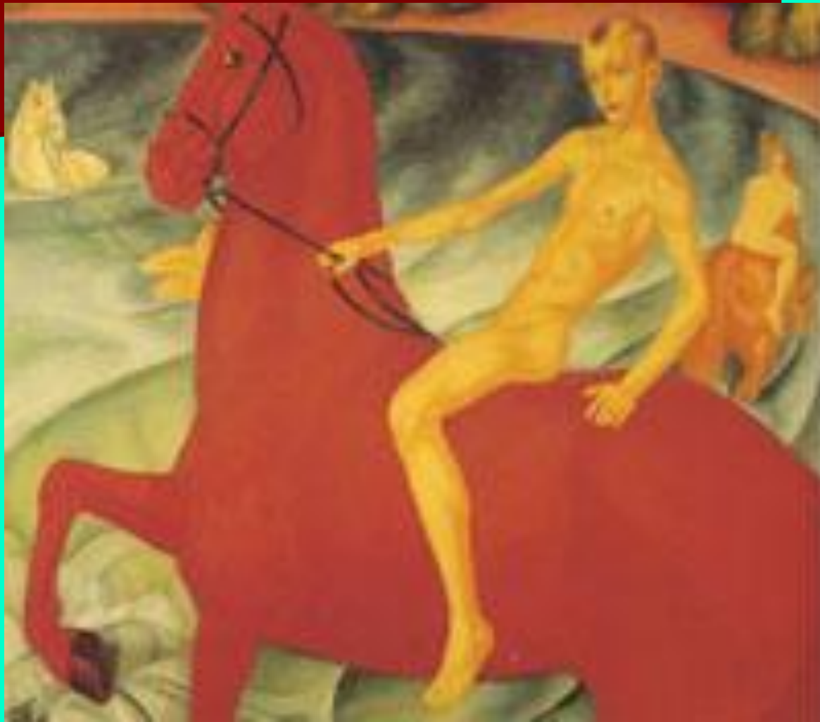
К.С.Петров-Водкин. Купание красного коня