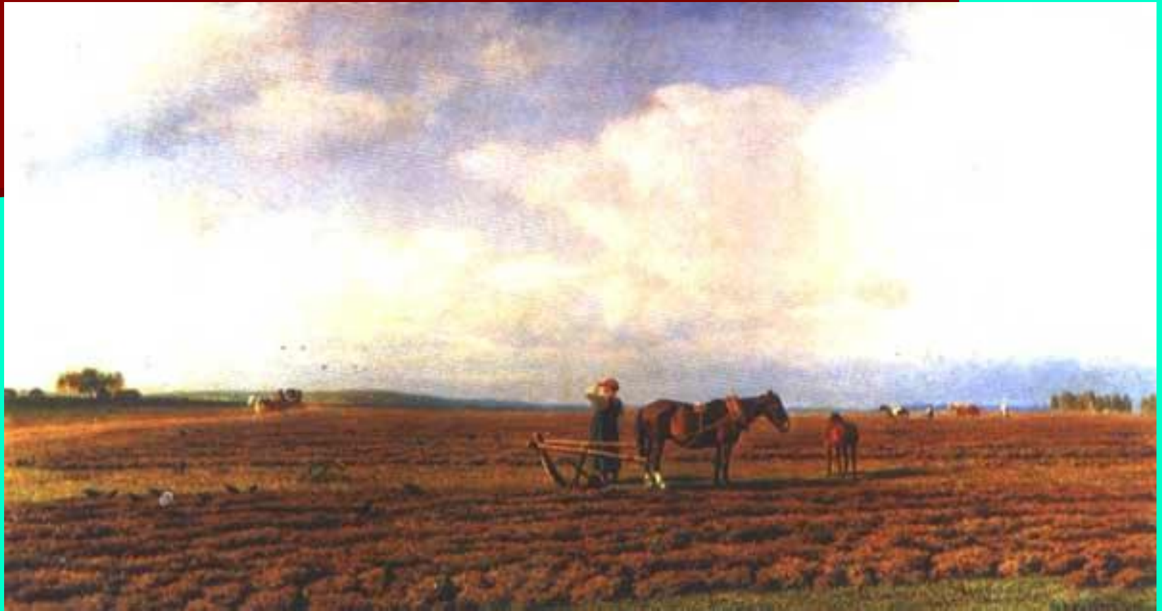
Клодт Михаил Константинович. На пашне. Холст, масло. 26х53