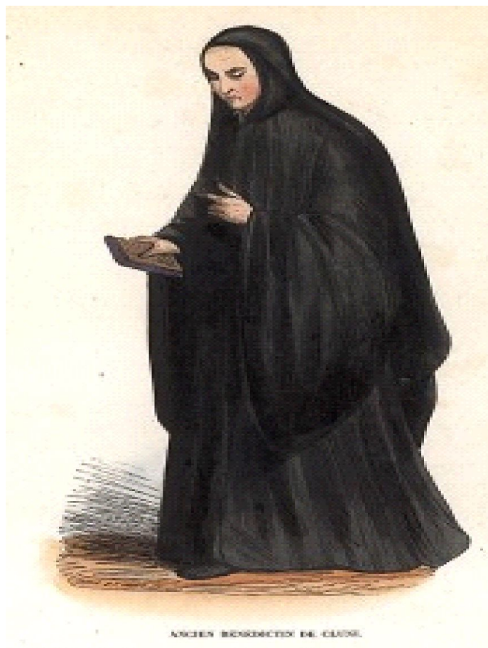
ANJEN BANGKOTEN DEL CLASSE