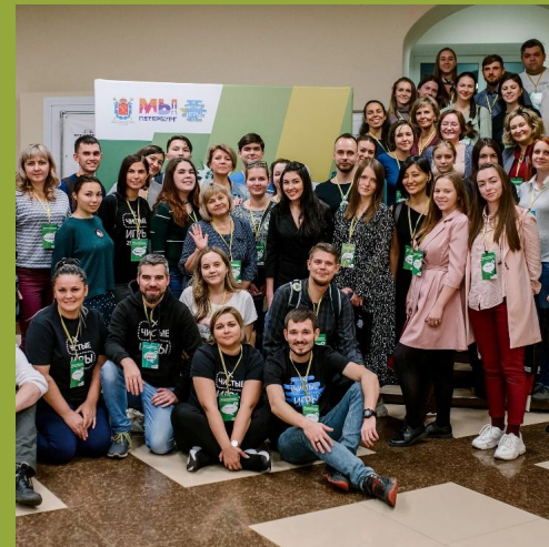
Annual Forum summer