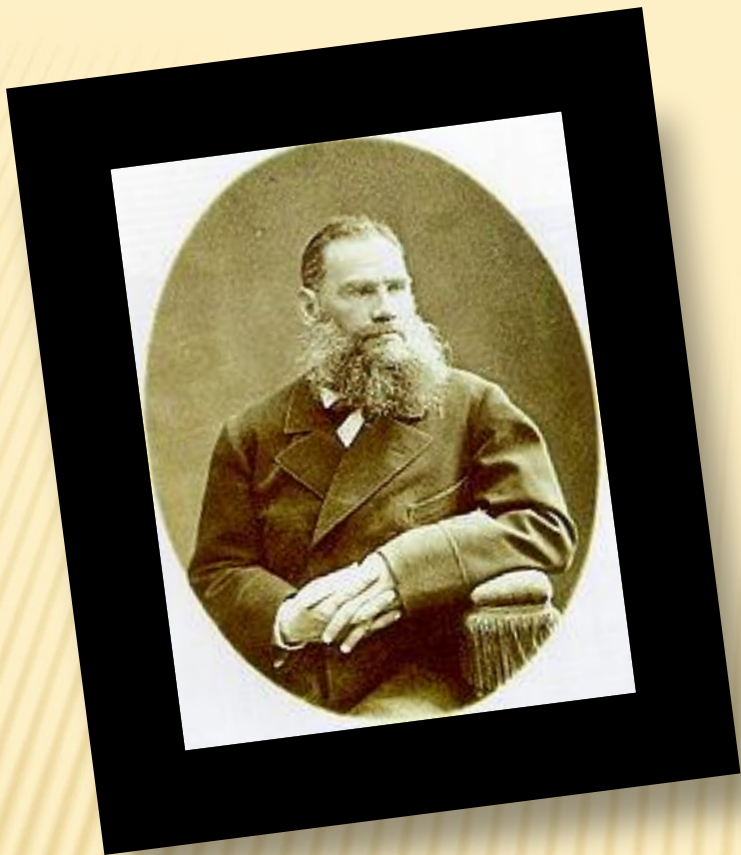
ЛЕВ НИКОЛАЕВИЧ ТОЛСТОЙ