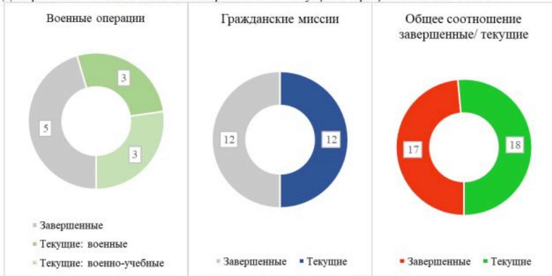
Диаграмма №1. Соотношение завершенных и текущих операций и миссий ОПБО