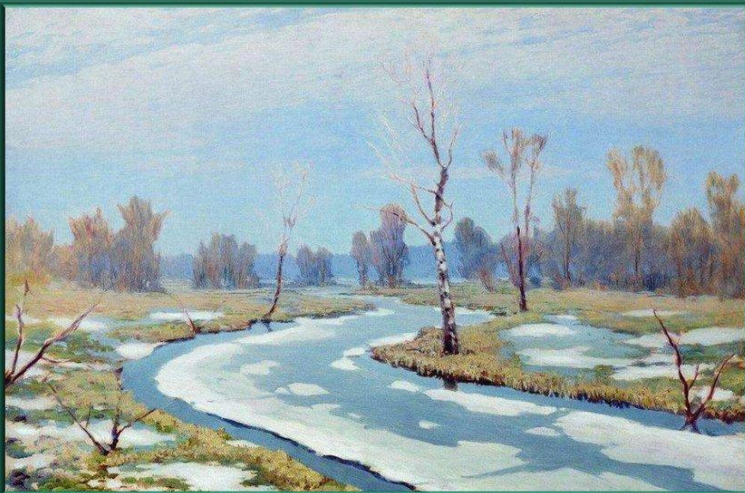
А. М. Куинджи «Ранняя весна»