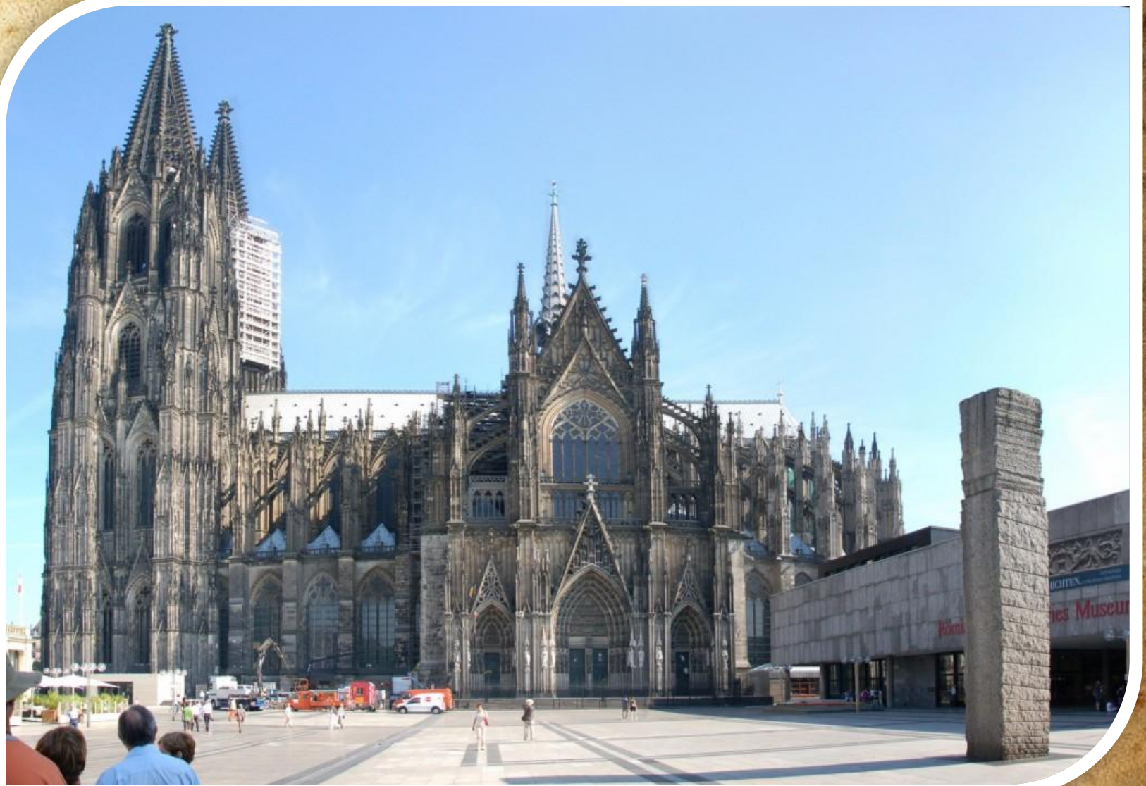
Собор в Кельне