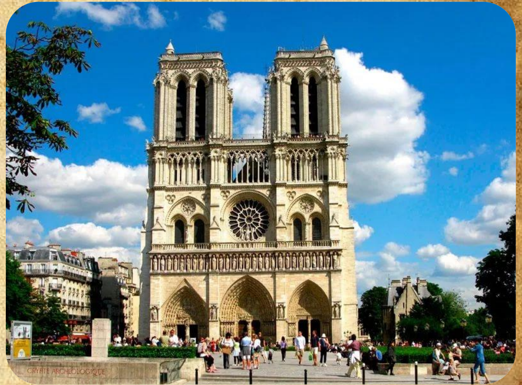
Собор Парижской Богоматери