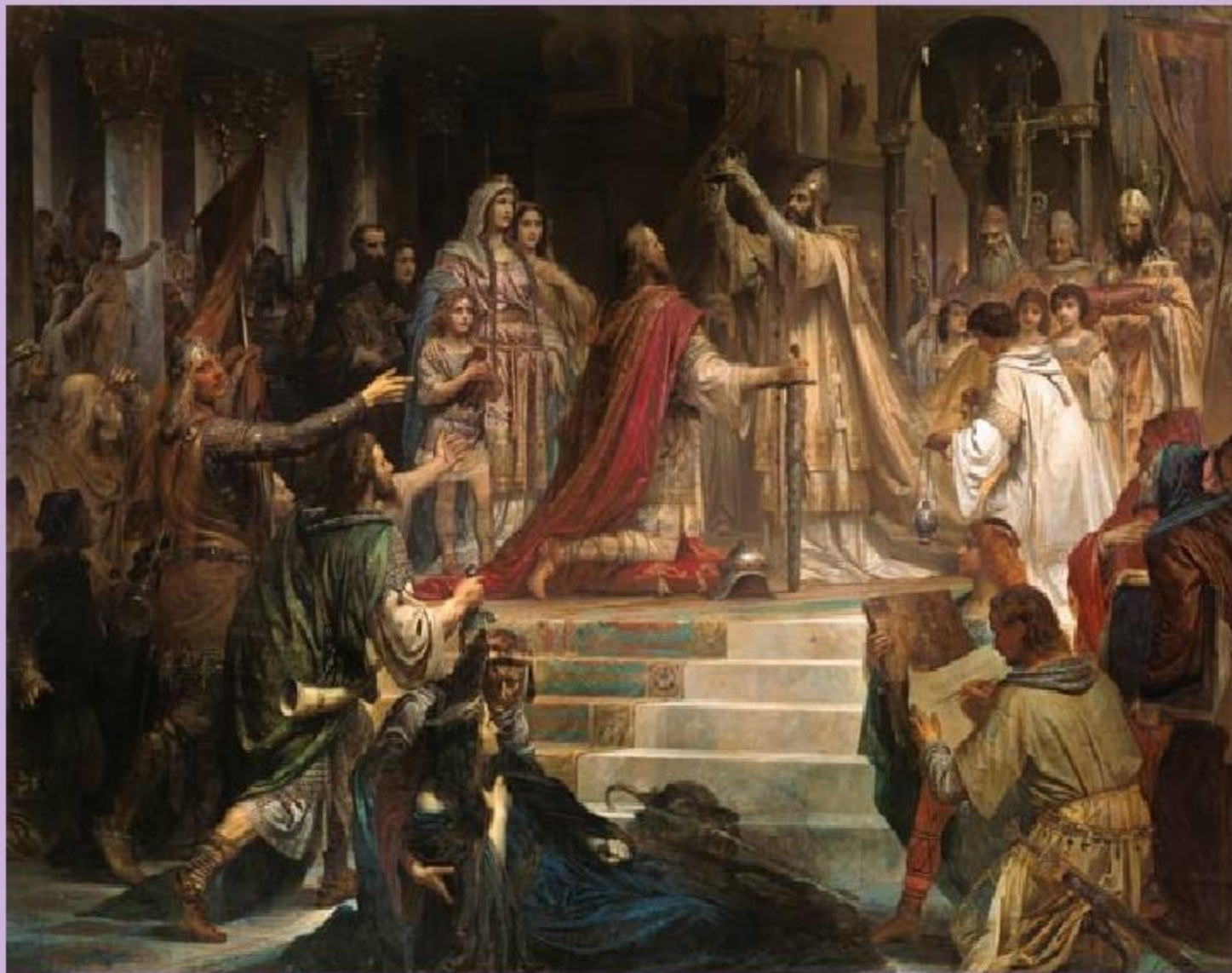
800 Г. Рим. Собор Св. Петра. Коронация Карла Великого папой римским Львом III

КАРЛ ВЕЛИКИЙ (768-814 Г) Высшая знать Европы была связана с императором присягой. Согласно этой присяге, знать должна была обязана явиться на войну в любой момент. Согласно указам Карла, изданным в 789 г., каждый свободный человек был обязан отыскать себе сеньора. Под началом этого сеньора он был обязан служить всю жизнь. Эти указы способствовали появлению огромного количества зависимых крестьян.