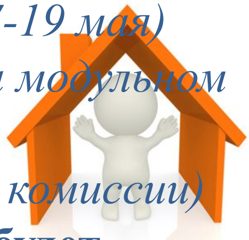
График защиты практики будет размещен на сайте