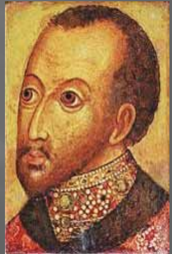
Царь Федор Иванович