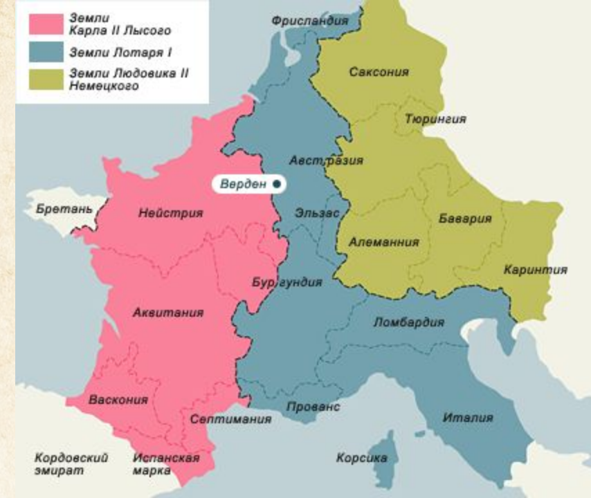
Раздел империи по Верденскому договору 843 г.

843 год – Верденский договор между 3 сыновьями Карла Великого, раздел империи. Западно-Франкское королевство