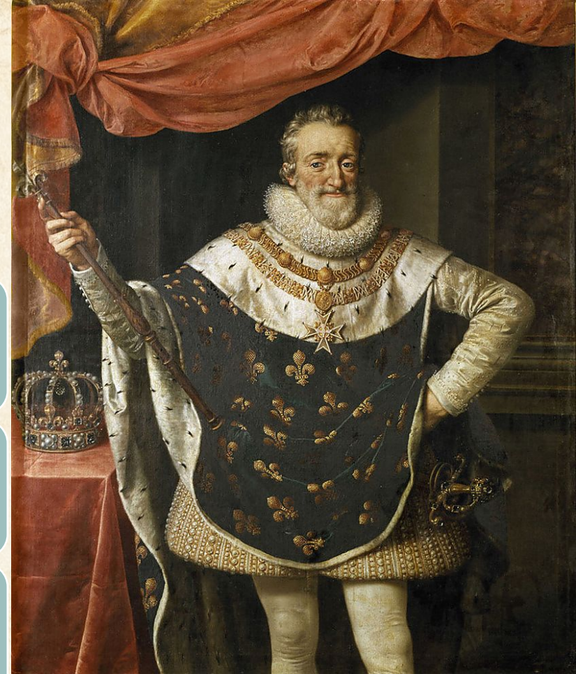
Генрих IV Валуа 1553-1610

Король обязан защищать церковь, поддерживать мир в королевстве, хранить верность народу, уважать правосудие