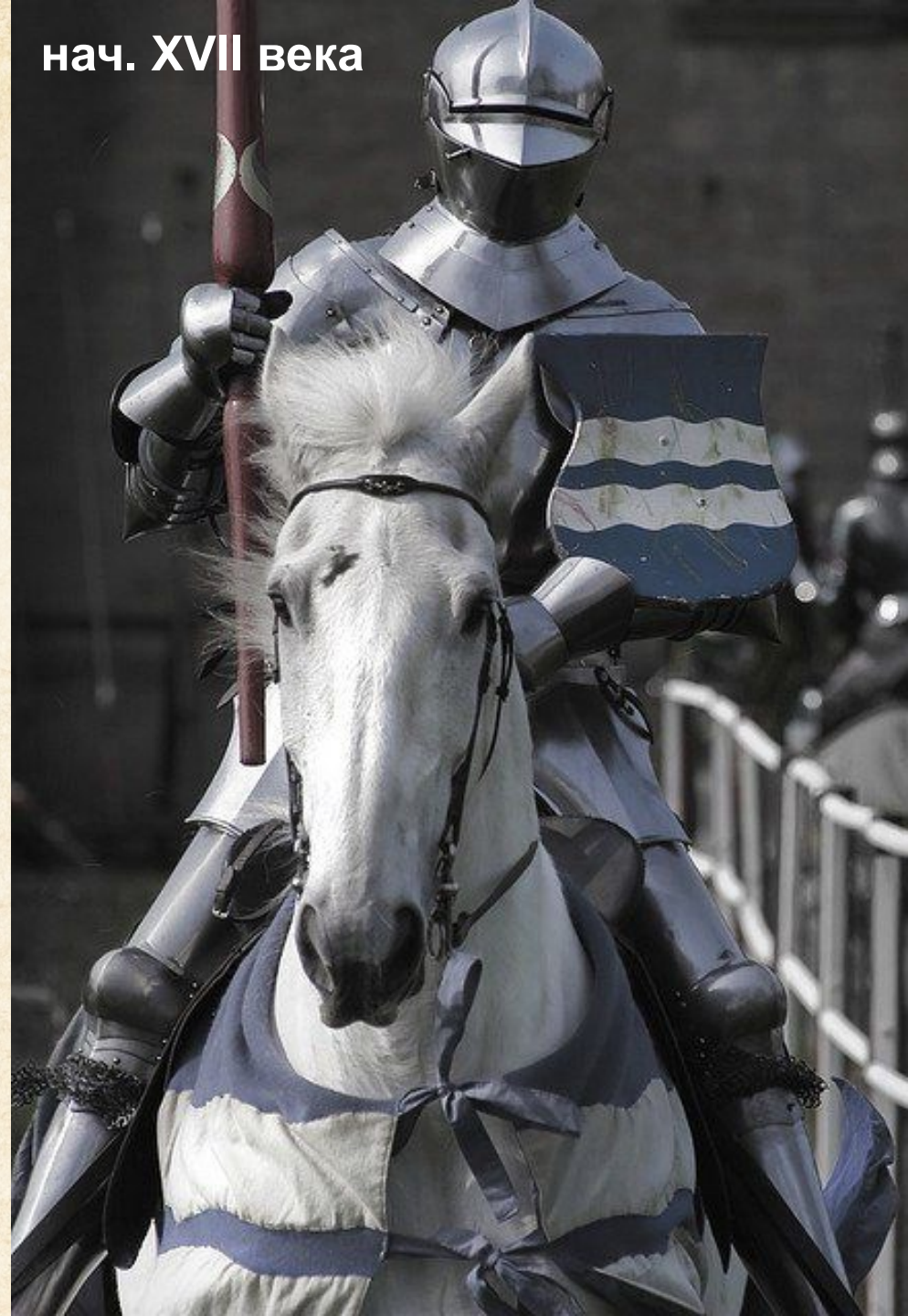
нач. XVII века