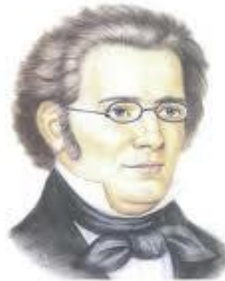
ШУБЕРТ ФРАНЦ (1797 – 1828)