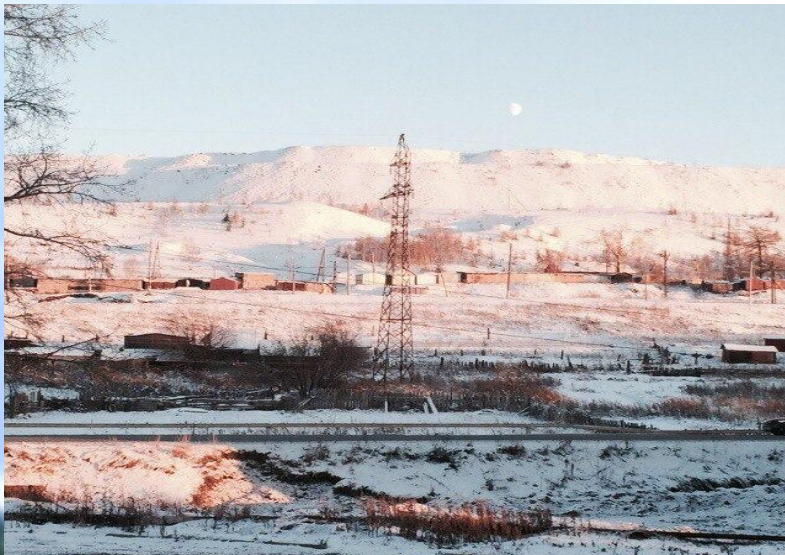
Отвалы. Вид с города