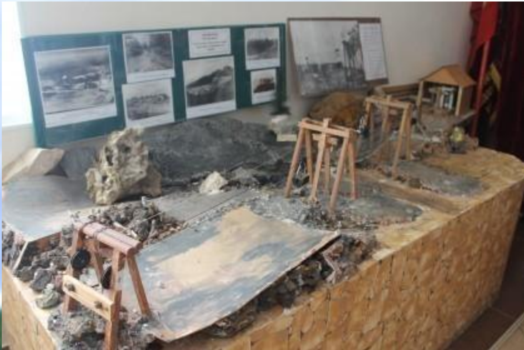
Музей истории и краеведения