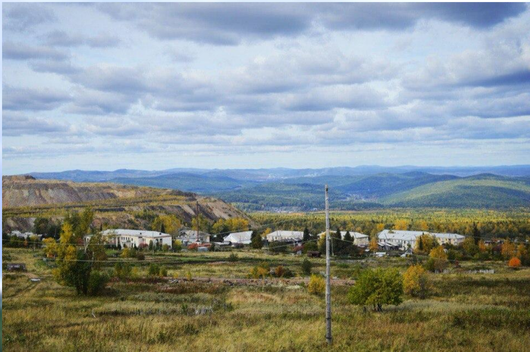
Поселок Иркутскан, вдали виднеется г. Сатка