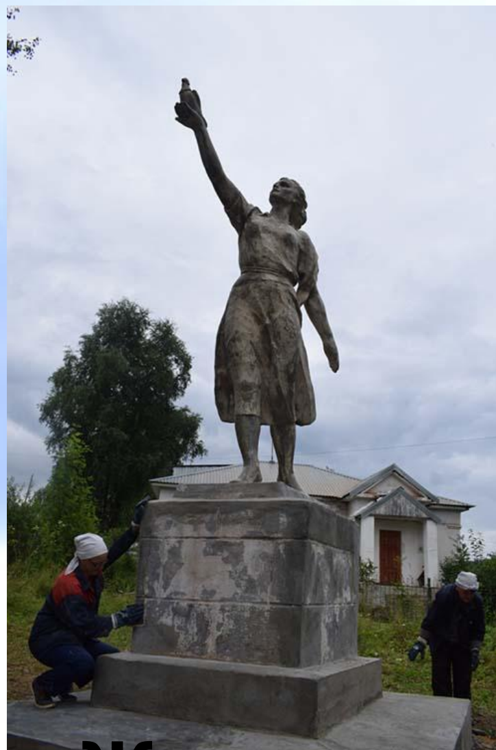
Женщина с голубем