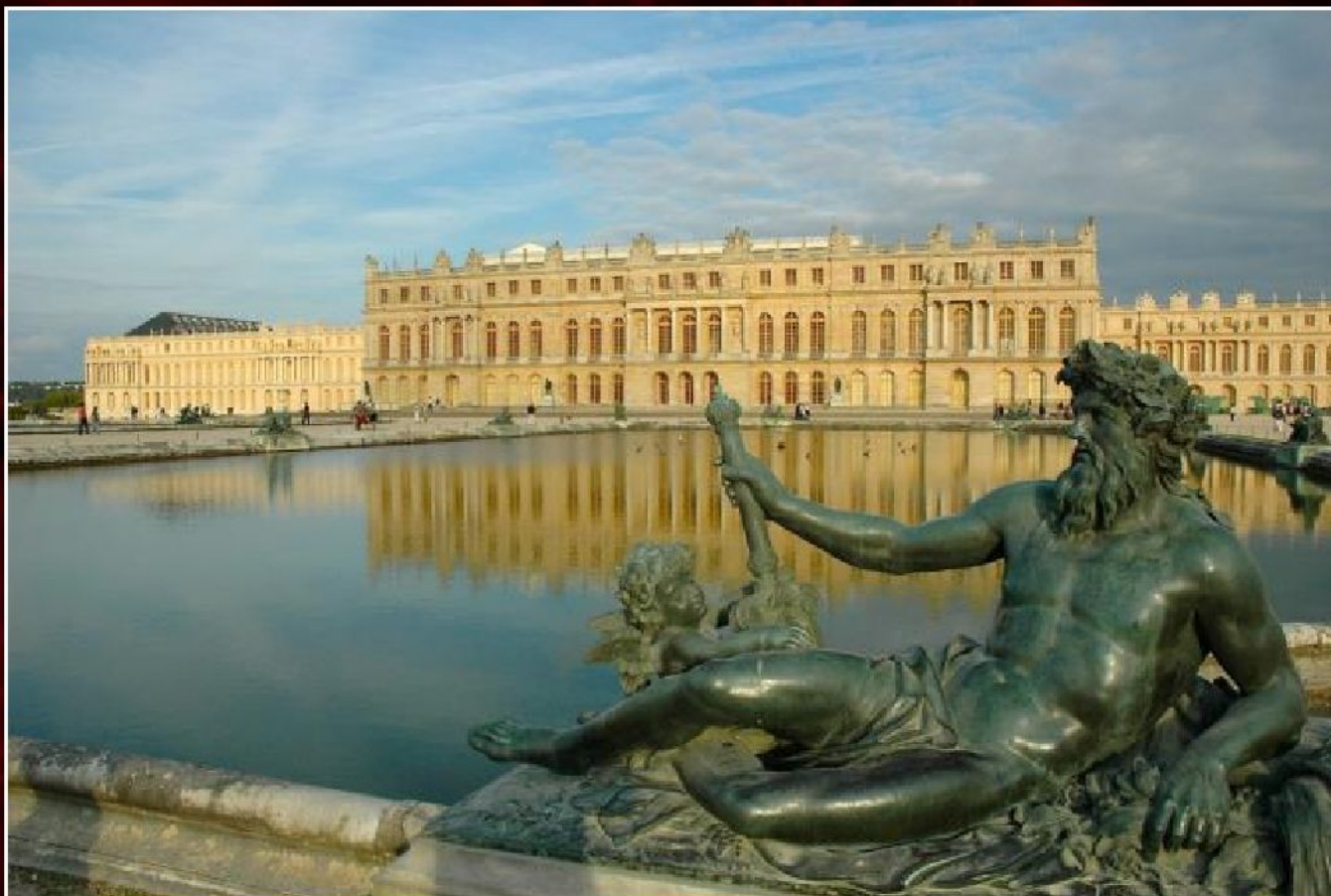
Жан-Баттист Тюби «Рона» (скульптурная группа в парке Версаля), ок. 1685