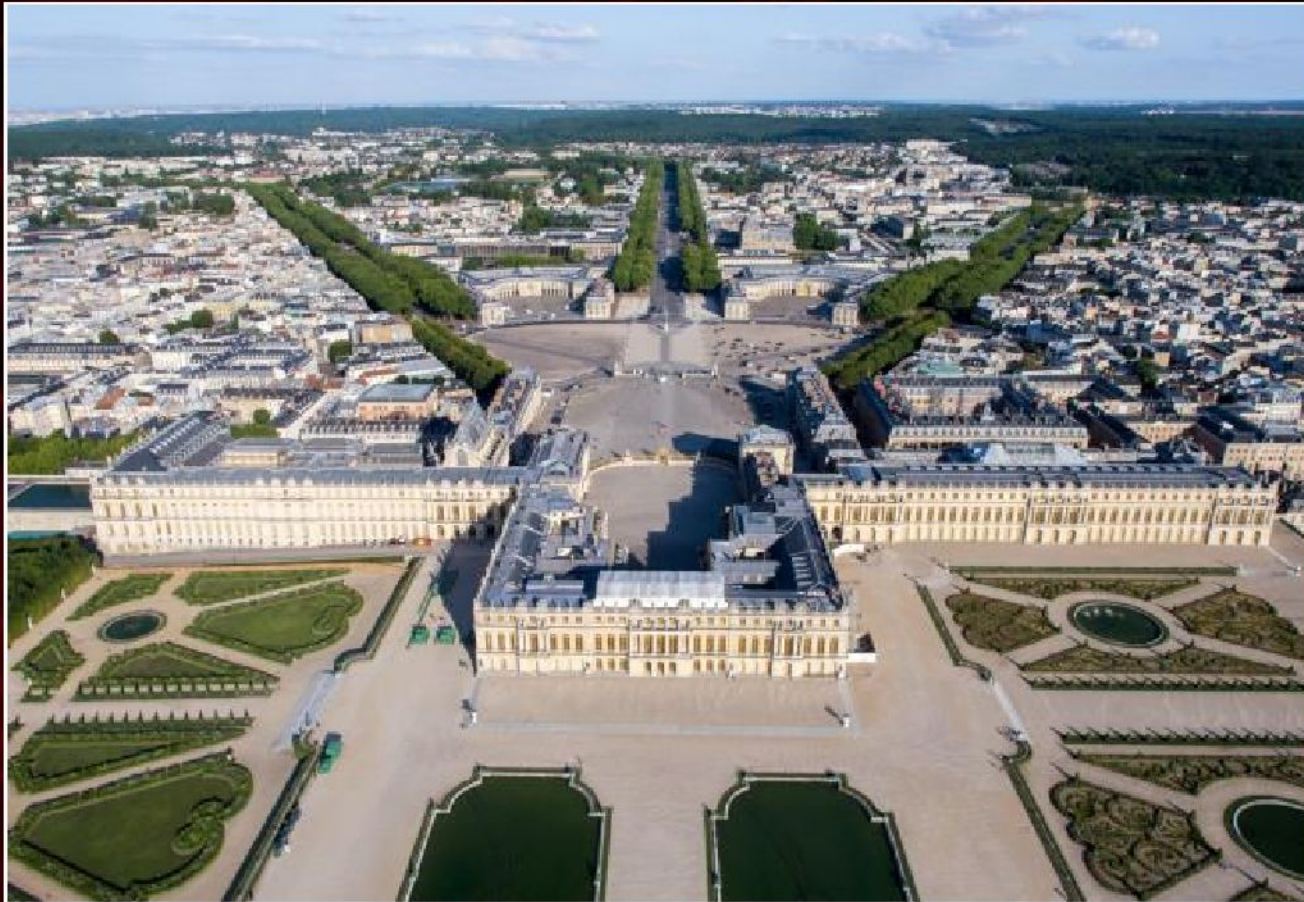
Общий вид Королевского дворца в Версале (Франция), 1668-1689