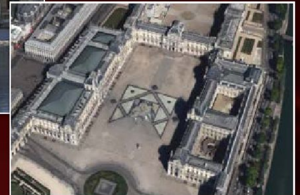
Жак Лемерсье. Западный корпус Лувра с «Павильоном часов» (Париж, Франция), 1624