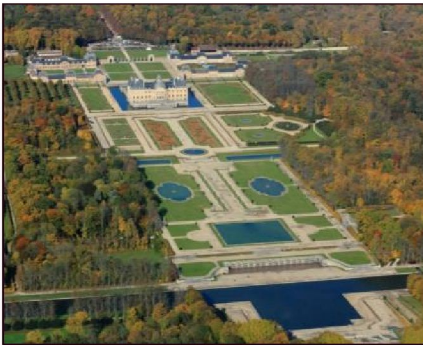
Луи Лево, Андре Ленотр Во ле Виконт (Франция), 1655-1661

Вокруг дворца в первой половине XVII в. архитектор обязательно устраивал парк, в котором царил жёсткий порядок: зеленые насаждения были аккуратно подстрижены, аллеи пересекались под прямым углом, цветники образовывали правильные геометрические фигуры.