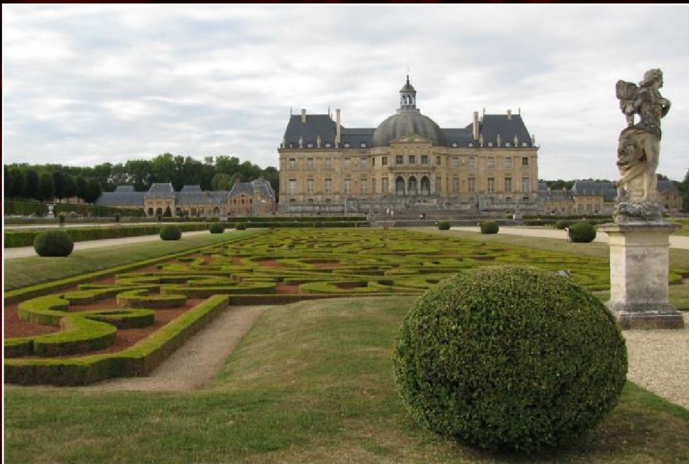
Луи Лево, Андре Ленотр. Во ле Виконт, дворец и партеры (Франция), 1655-1661