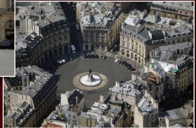
Жюль Ардуэн-Мансар. Площадь Побед (Париж, Франция), 1685