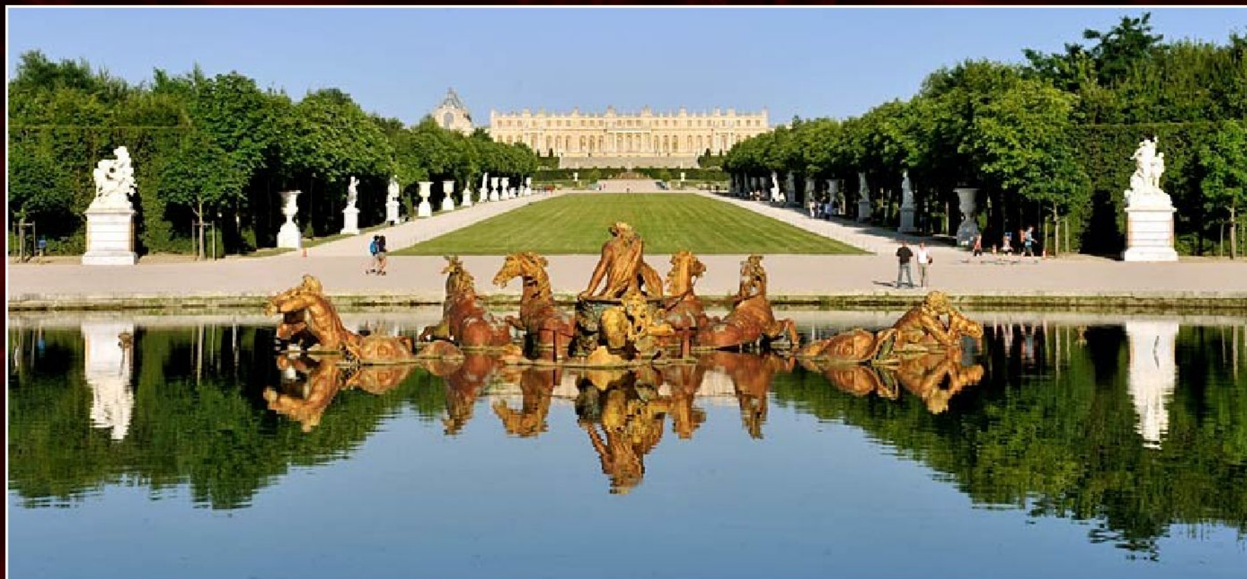
Вид от фонтана «Аполлон на колеснице» на главную королевскую аллею парка в Версале (Франция)