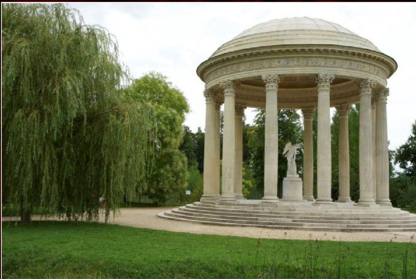
Ришар Мик. Храм любви в парке Малого Трианона (Версаль, Франция), 1775