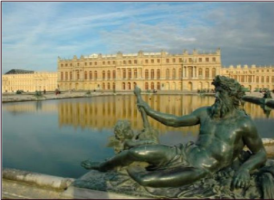
Версаль (Франция), 1668-1689

Классицизм - это стиль европейского искусства середины XVII - начала XIX веков. Он появился в Италии одновременно со стилем Барокко, но противопоставлялся ему в художественных принципах.