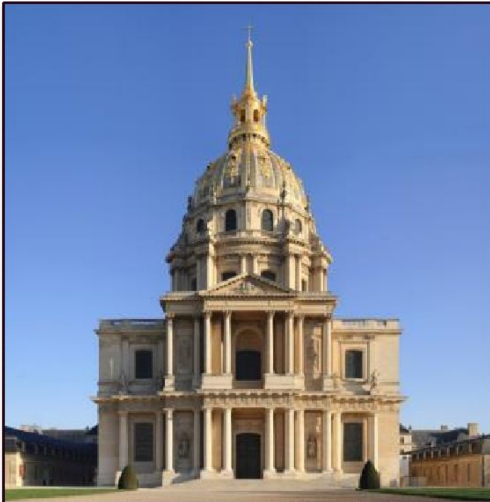
Жюль Ардуэн-Мансар. Собор Дома инвалидов (Париж, Франция), 1680-1706

Архитектура классицизма обращается к формам античного зодчества как к эталону гармонии, логической ясности, строгости и монументальности.