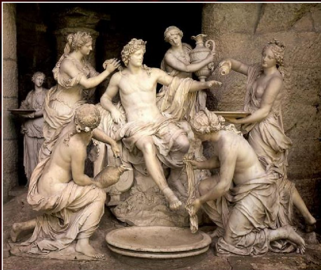
Франсуа Жирардон «Аполлон и нимфы» (скульптурная группа в парке Версаля), 1666-1675