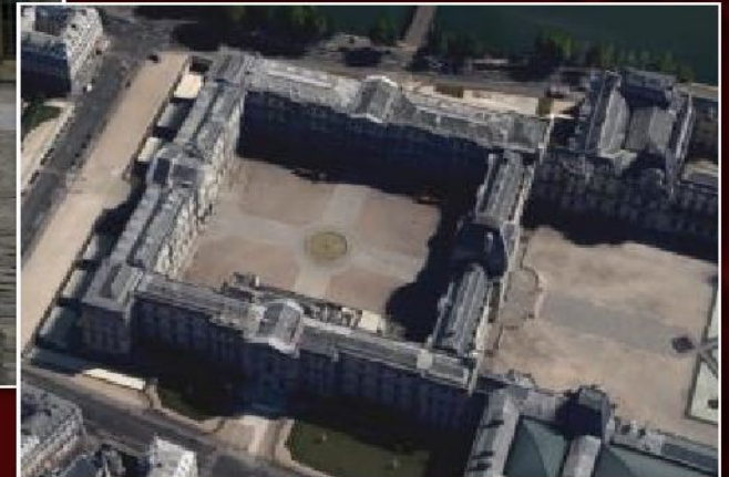
Луи Лево. Фасады Квадратного двора Лувра (Париж, Франция), 1613