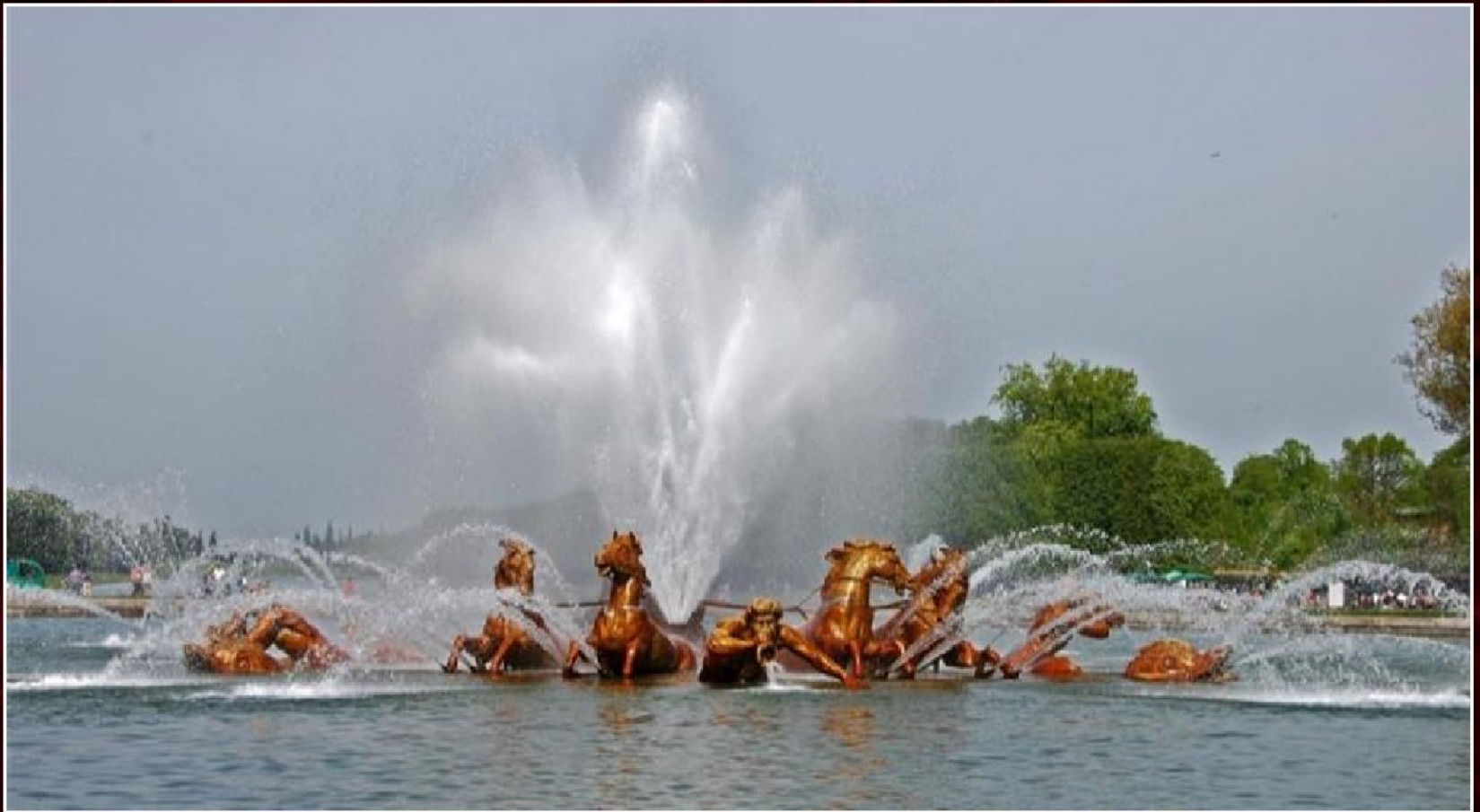
Жан-Батист Тюби «Аполлон на колеснице» (фонтан Аполлона в парке Версаля), 1668-1670