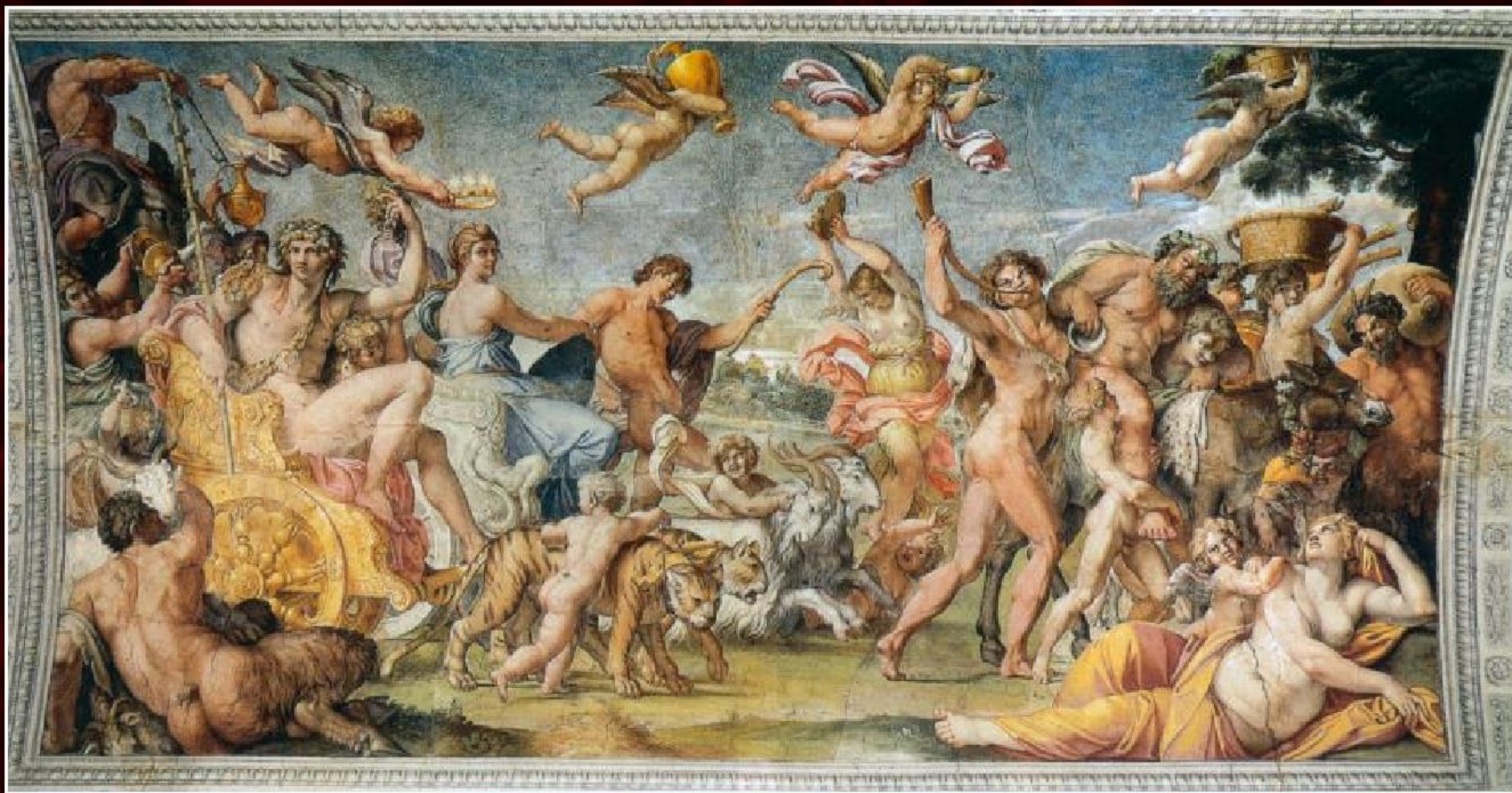
Аннибале и Агостино Карраччи «Триумф Вакха и Ариадны» (фреска палатцо Фарнезе, Рим), 1597-1604