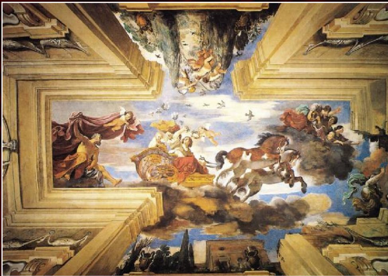
Гверчино (Франческо Барбьери) «Аврора» (фреска виллы Людовизи, Рим), 1621-1623