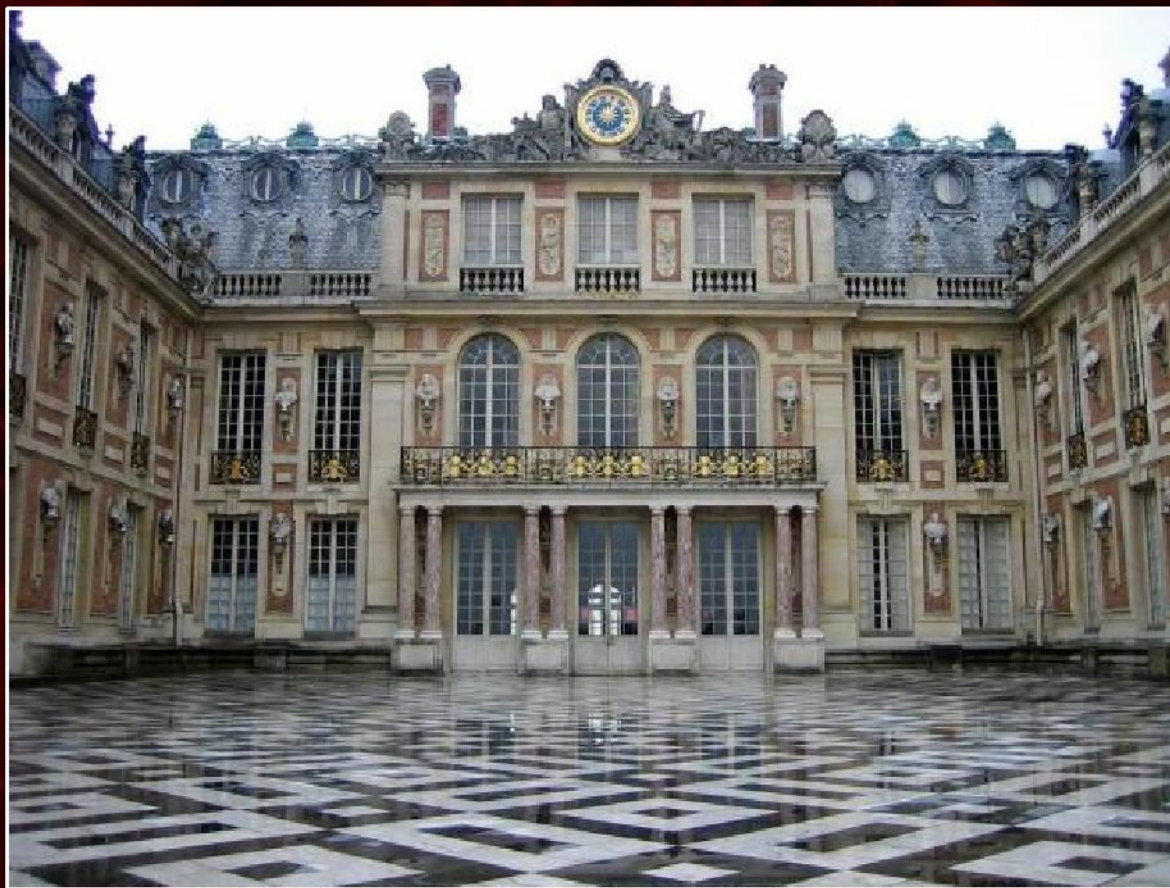
Луи Лево, Жюль Ардуэн-Мансар. Мраморный двор Королевского дворца в Версале (Франция), 1668-1689