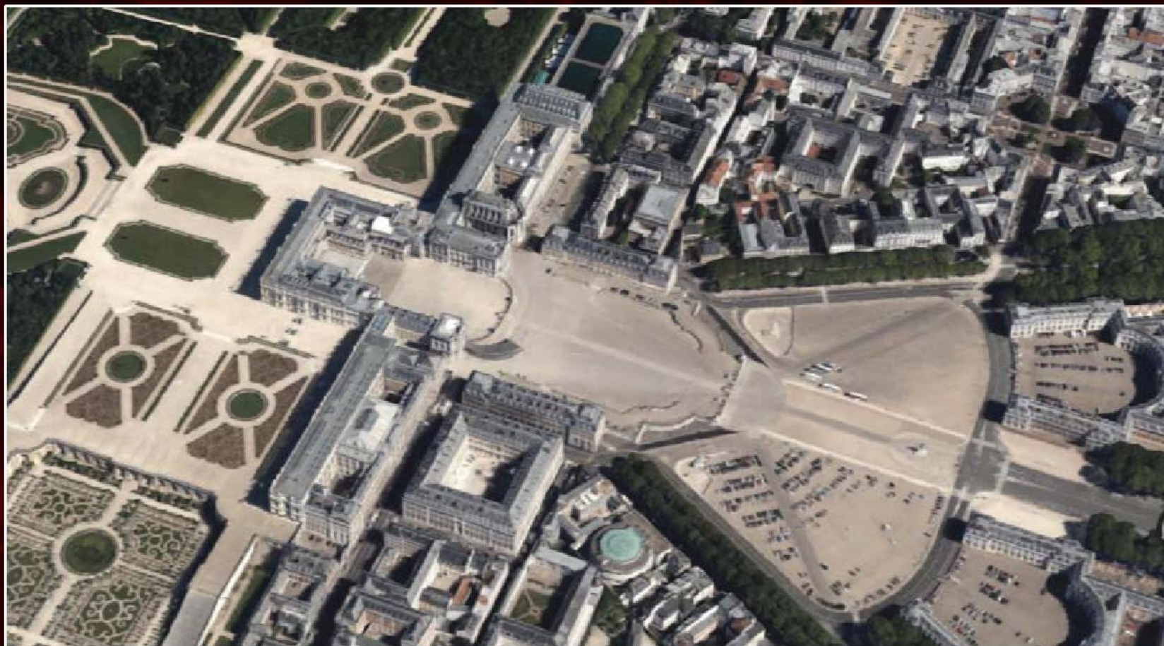
Общий вид Королевского дворца в Версале (Франция), 1668-1689