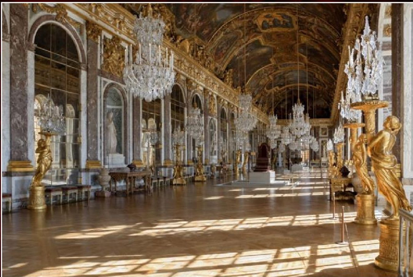
Ж. Ардуэн-Мансар, Ш. Лебрэн. Зеркальная галерея во дворце Версаля (Франция), 1678-1686