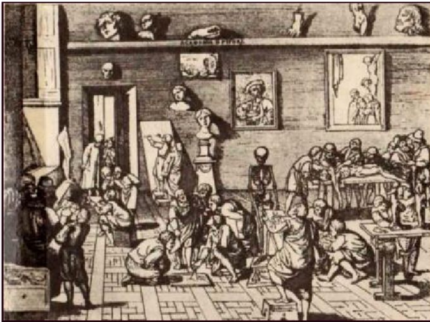
Римская Академия художеств, 1600

В качестве идеала Болонская академия провозгласила искусство античности, Возрождения и прежде всего творчество Рафаэля, но противостояла идеям маньеризма.