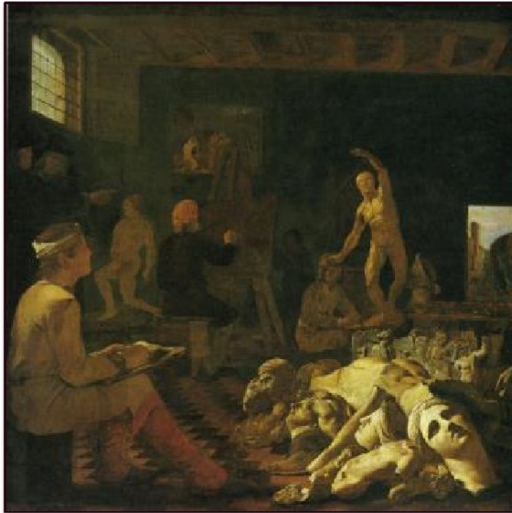
Михаэль Свертс «Мастерская художника», ок. 1646-1650

Название стиля происходит от латинского слова «classicus» - «образцовый». Художники классицизма признавали высшим образцом античное искусство и опирались на традиции искусства эпохи Возрождения.