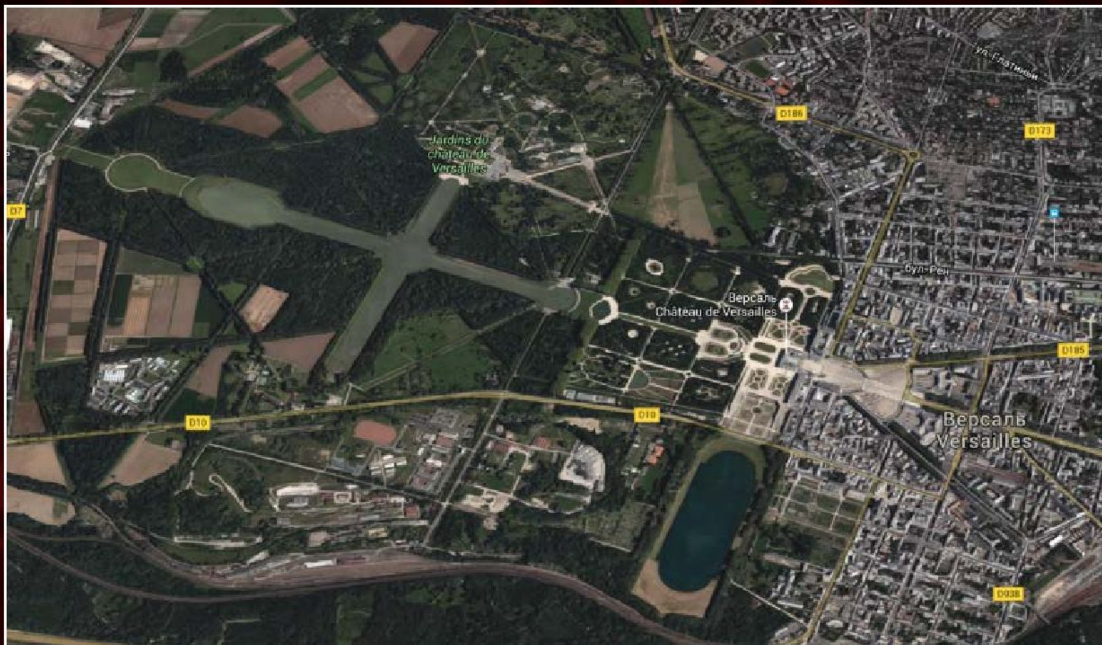
Общий вид дворцово-паркового ансамбля Версаля (Франция), 1668-1689