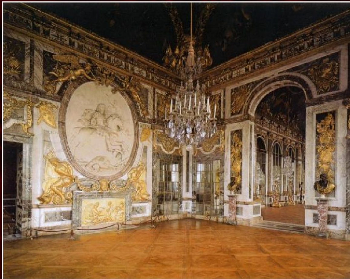
Ж. Ардуэн-Мансар, Ш. Лебрен. Зал Войны во дворце Версаля (Франция), 1678-1686