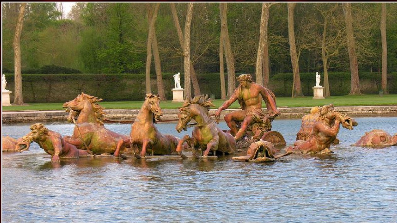
Жан-Батист Тюби «Аполлон на колеснице» (фонтан Аполлона в парке Версаля), 1668-1670