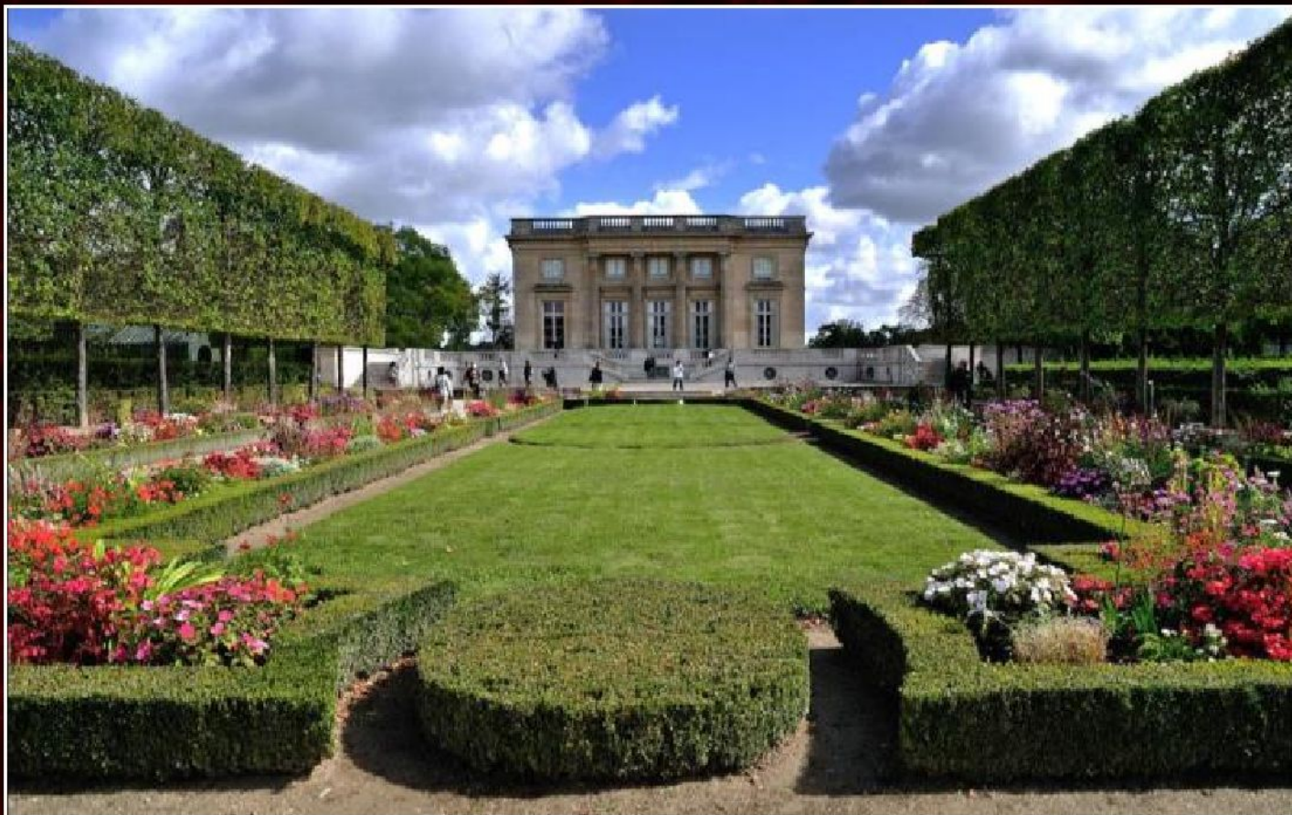
Анж-Жак Габриэль. Малый Трианон в Версальском парке (Франция), 1762-1768