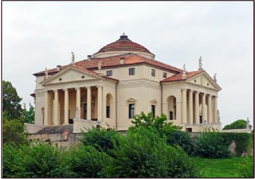
Андреа Палладио Вилла Капра близ Виченце (Вилла Ротонда), позднее Возрождение, Северная Италия, 1551-1567

Архитектурный язык классицизма был сформулирован в конце эпохи Возрождения венецианским мастером Андреа Палладио.