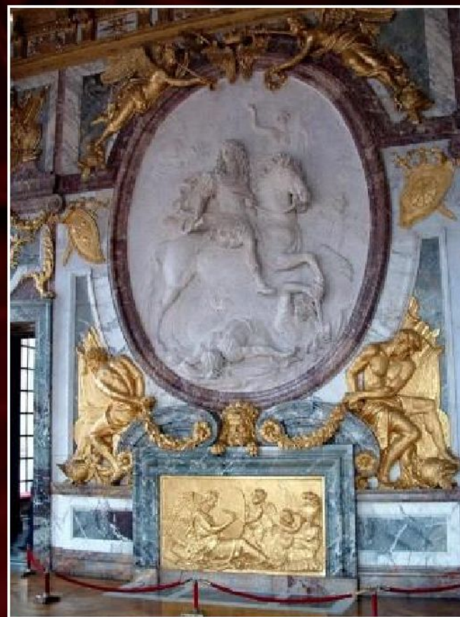
Антуан Куазево «Триумф Людовика XIV» (рельеф зала Войны, Королевский дворец Версаля), 1678-1686