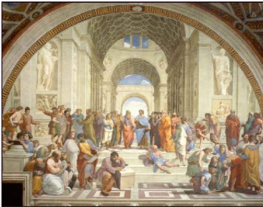
Рафаэль Санти «Афинская школа», 1508-1511

Уже в эпоху Возрождения античное искусство стало восприниматься как идеал. Следующим этапом зарождения классицизма стала Болонская академия, в которой происходит сложение канонов академизма (мера правильного и неправильного в искусстве).