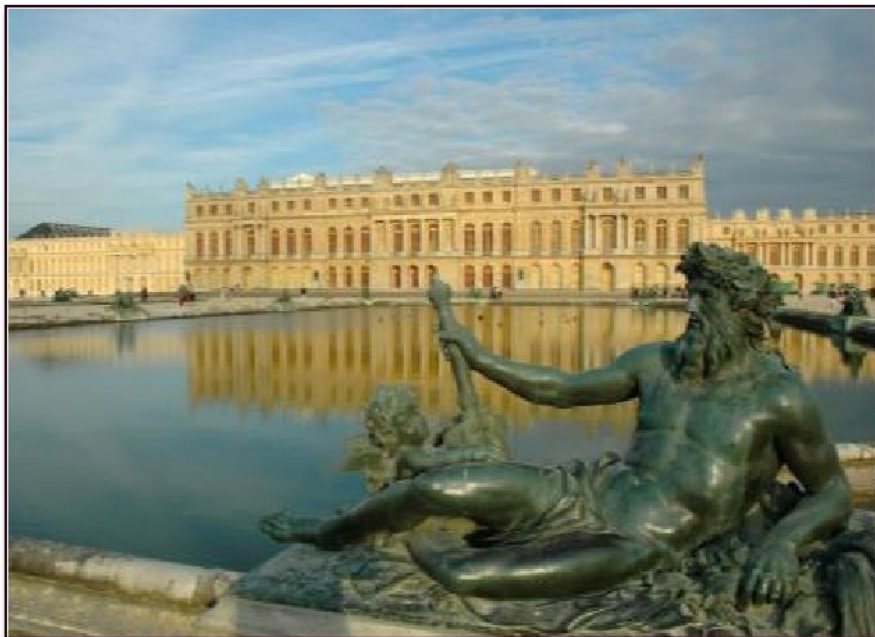
Версаль (Франция), 1668-1689

Версаль – главная резиденция французских королей. План Версаля отличается ясностью, симметрией и стройностью.