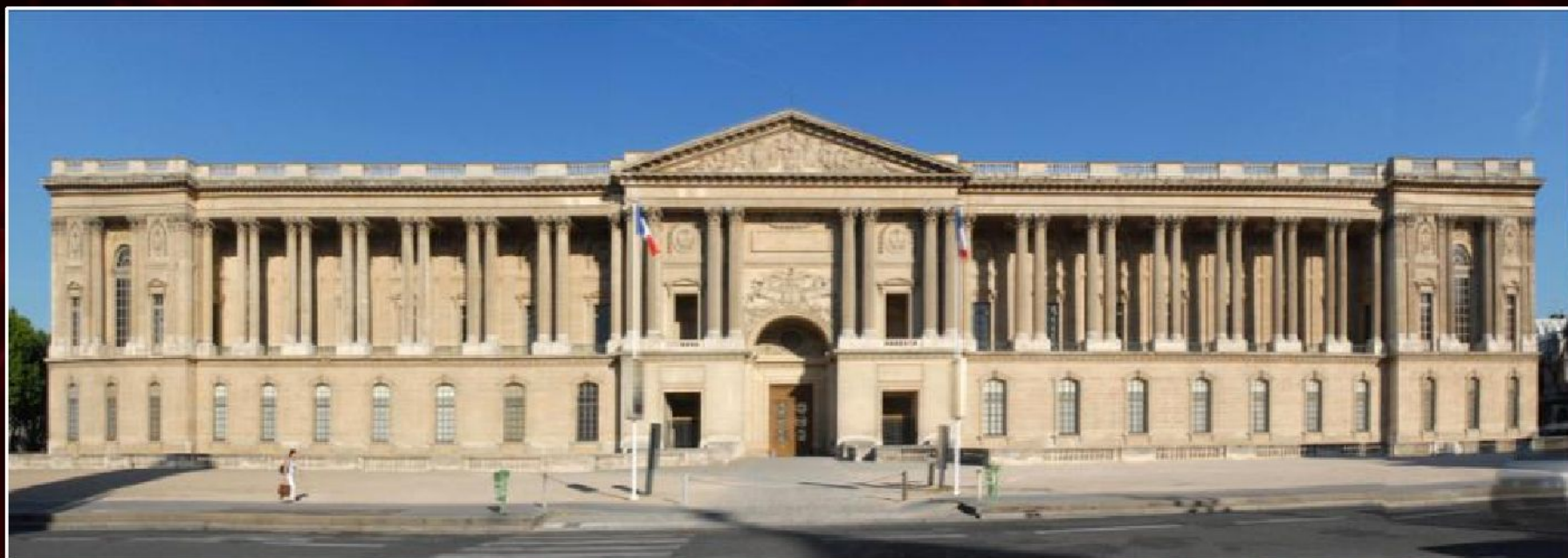
Клод Перро. Восточный фасад Лувра ( «Колоннада Лувра», Париж, Франция), 1667-1674