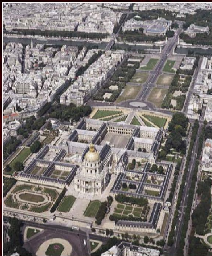
Либераль Брюан, Жюль Ардуэн-Мансар, Робер де Кот. Комплекс построек Дома инвалидов (Париж, Франция), 1671-1706