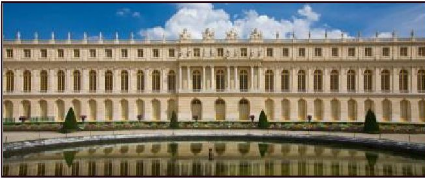
Королевский дворец в Версале (парковый фасад и интерьер Зеркальной галереи)