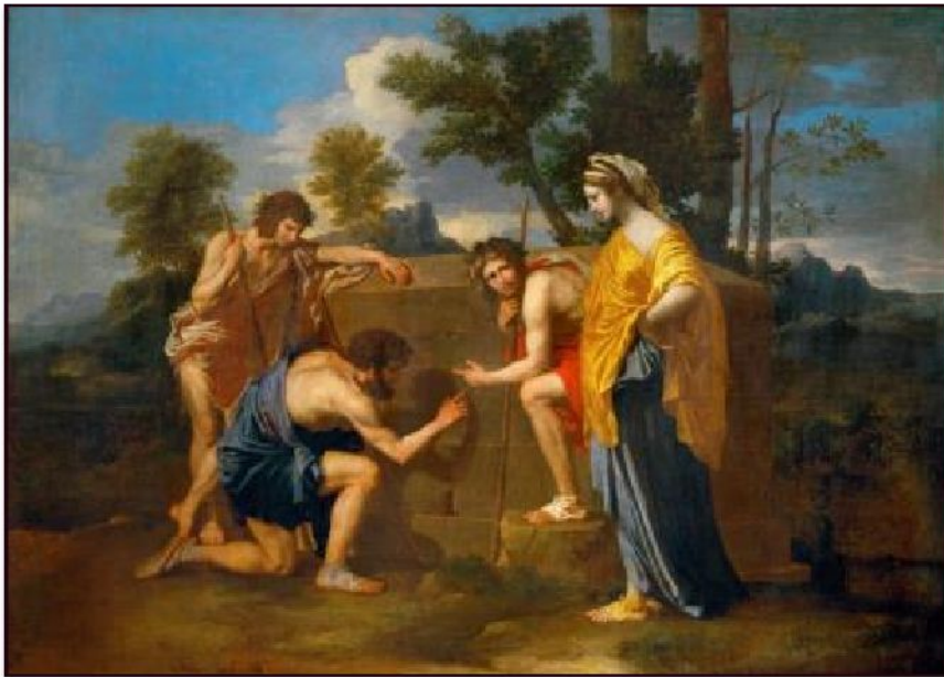
Никола Пуссен «Аркадские пастухи», ок. 1637-1638

Прекрасным с точки зрения классицизма является лишь то, что упорядоченно, разумно, гармонично.