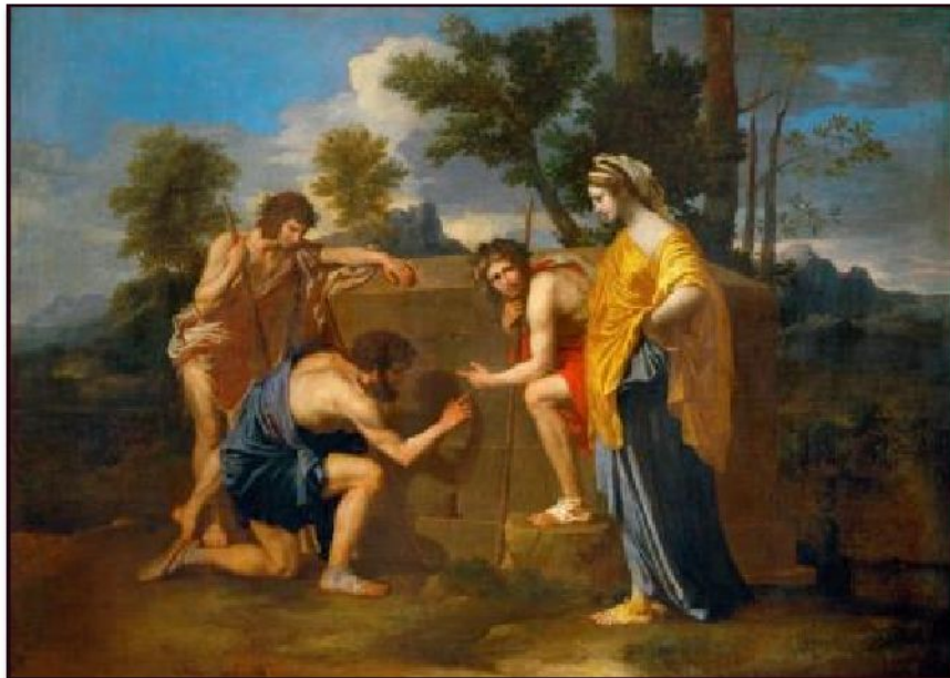
Никола Пуссен «Аркадские пастухи», ок. 1637-1638

О развитии классицизма в Болонской академии в чистом виде говорить нельзя, это была эклектичная школа, которая в частности повлияла на формирование живописи барокко.