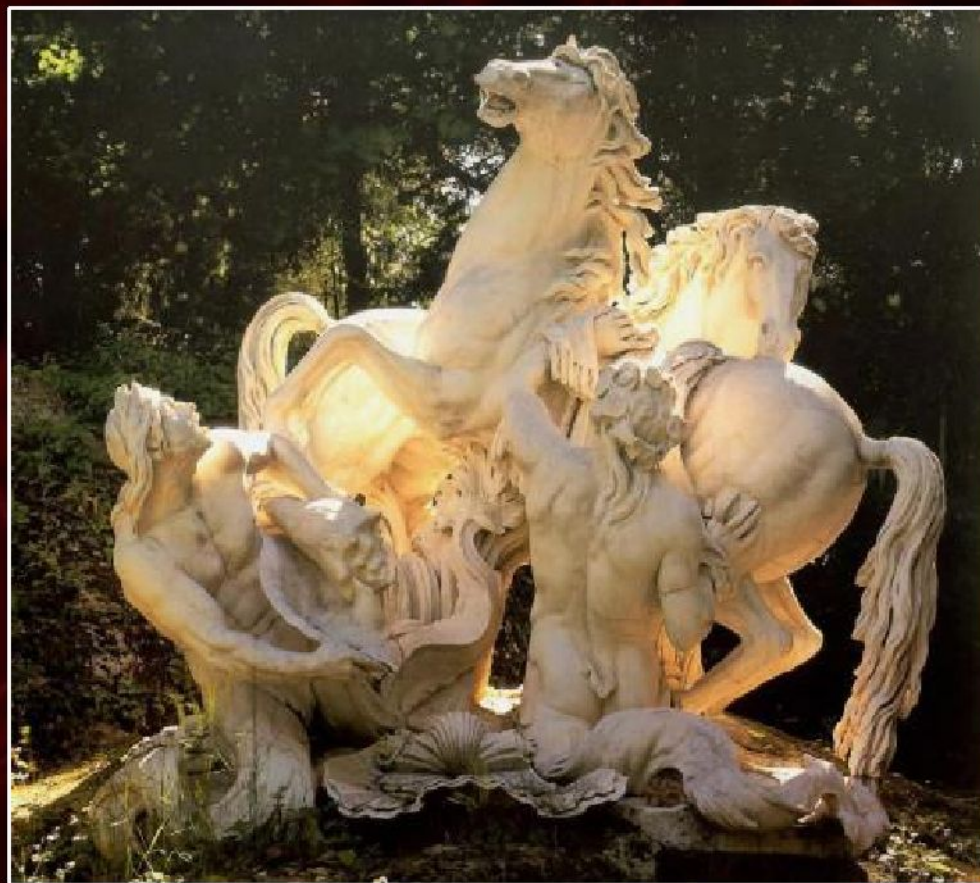
Бальтасар и Гаспар Марси «Огненные кони Аполлона» (скульптурная группа в парке Версаля), 1668-1675