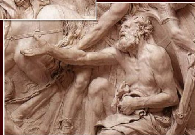
Пьер Пюже «Встреча Александра Македонского с Диогеном», 1692