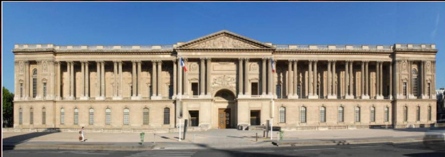
Клод Перро. Восточный фасад Лувра («Колоннада Лувра», Париж, Франция), 1667-1674

Выполнить в рабочей тетради зарисовку одного из известнейших произведений архитектуры классицизма XVII века.