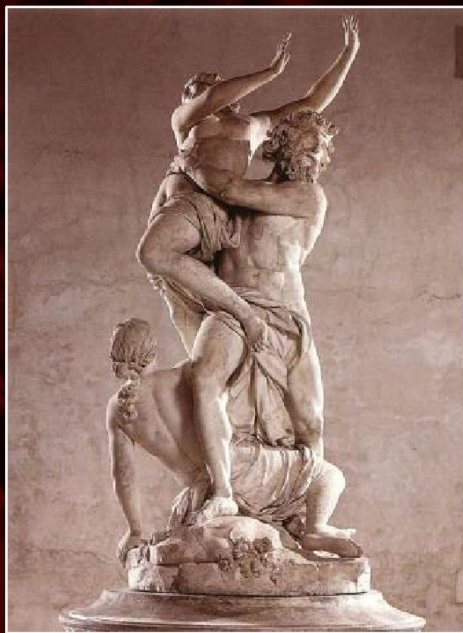
Франсуа Жирардон «Похищение Прозерпины» (скульптурная группа в парке Версаля), 1677-1699