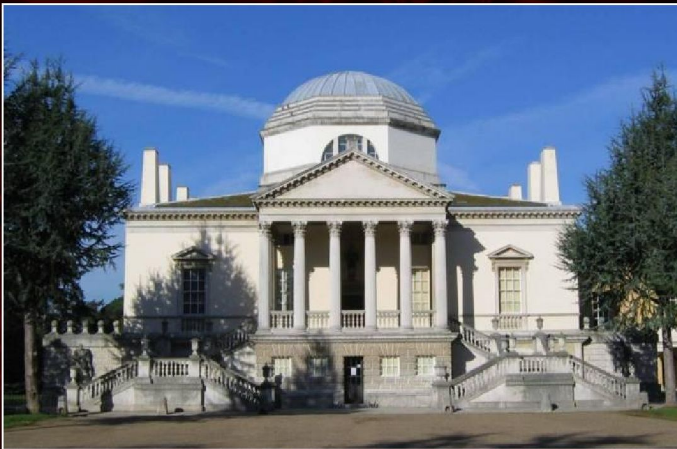
Ричард Бойл Бёрлингтон. Вилла в Чизике (Англия), 1723-1729