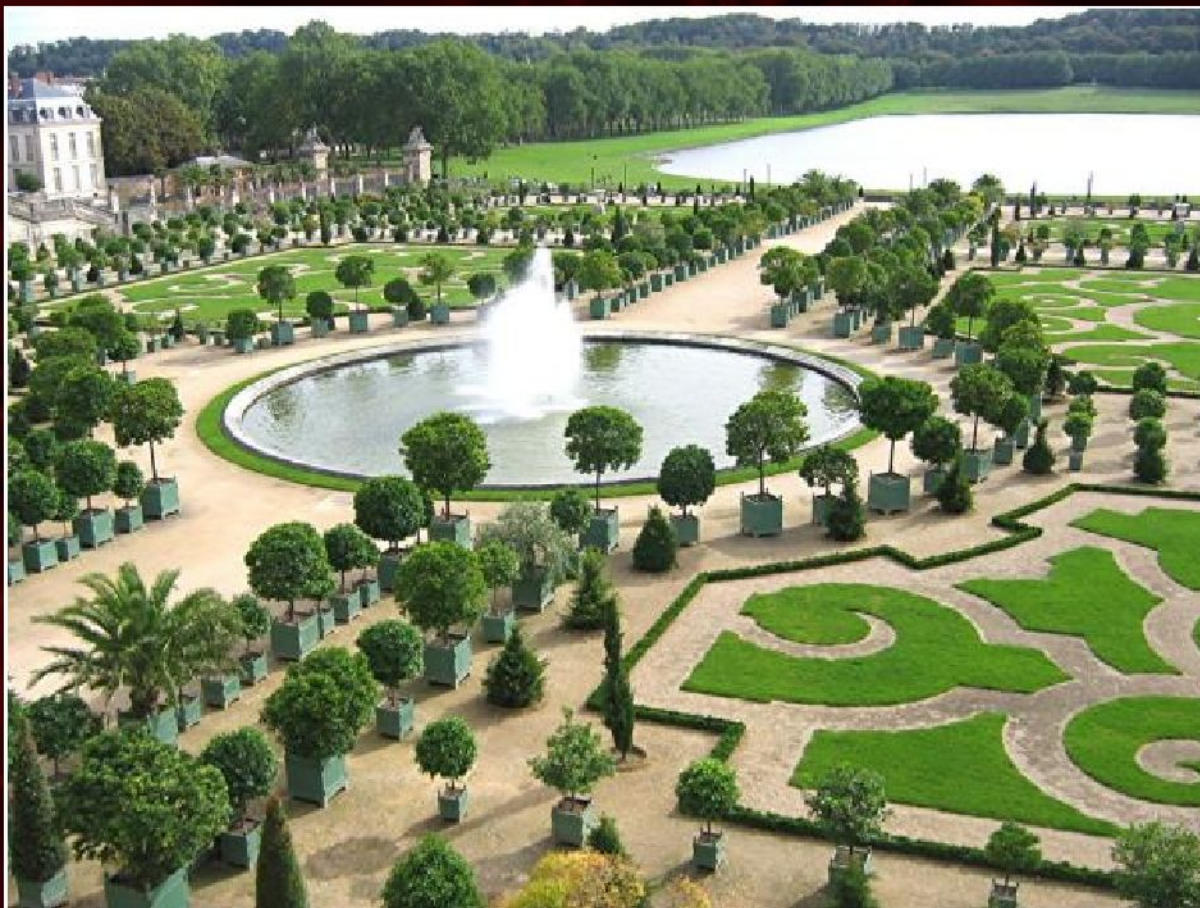
Андре Ленотр. Партер перед оранжереей в Версале (Франция), 1678-1686