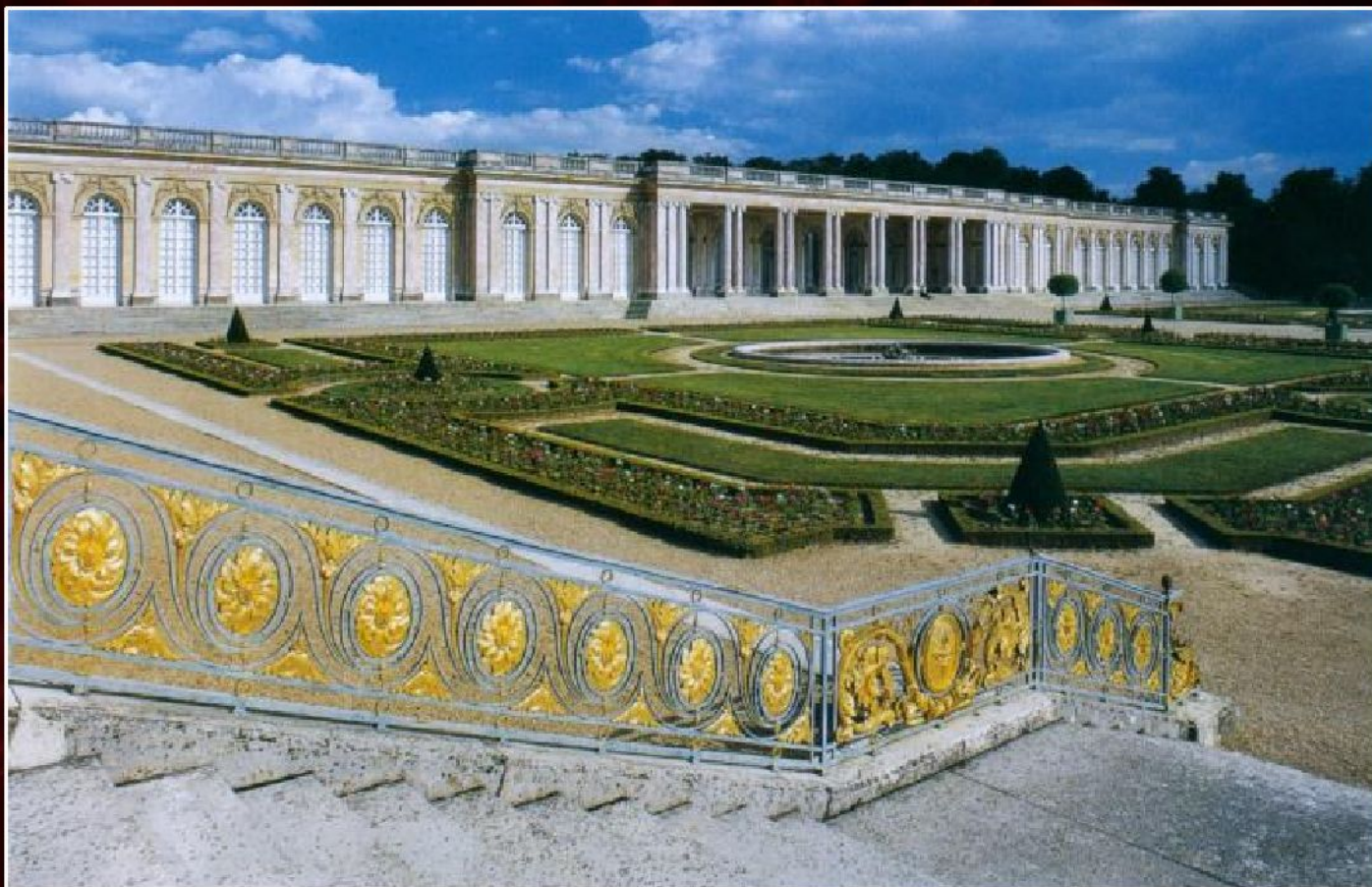
Жюль Ардуэн-Мансар. Большой Трианон в Версальском парке (Франция), 1670-1687