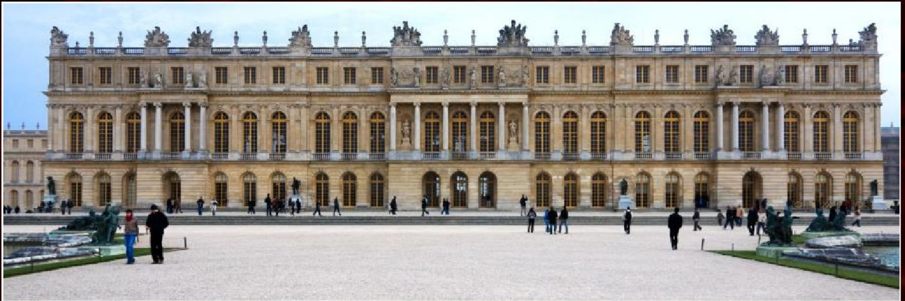
Луи Лево, Жюль Ардуэн-Мансар. Садовый фасад Королевского дворца в Версале (Франция), 1668-1689