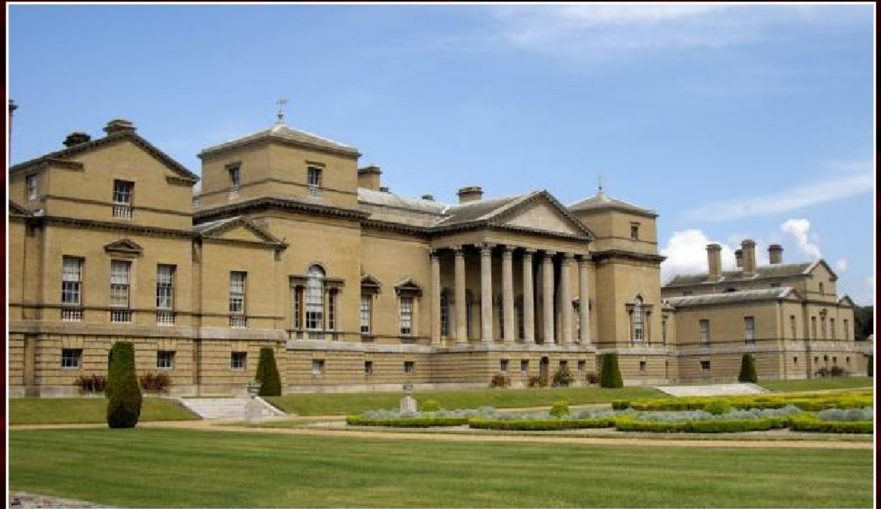
Уильям Кент. Дом в усадьбе Холкем-хол (Норфолк, Англия), 1734-1764