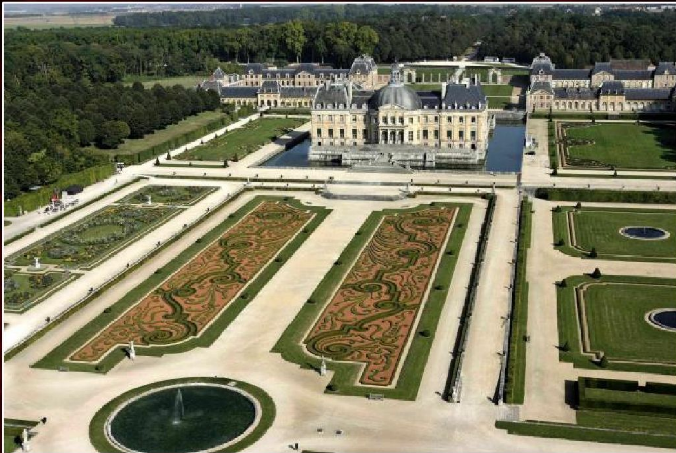
Луи Лево, Андре Ленотр. Во ле Виконт, дворец и партеры (Франция), 1655-1661