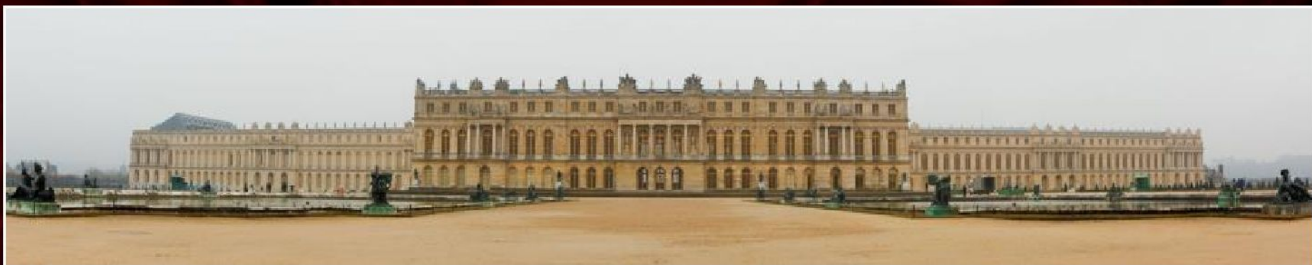
Луи Лево, Жюль Ардуэн-Мансар. Садовый фасад Королевского дворца в Версале (Франция), 1668-1689