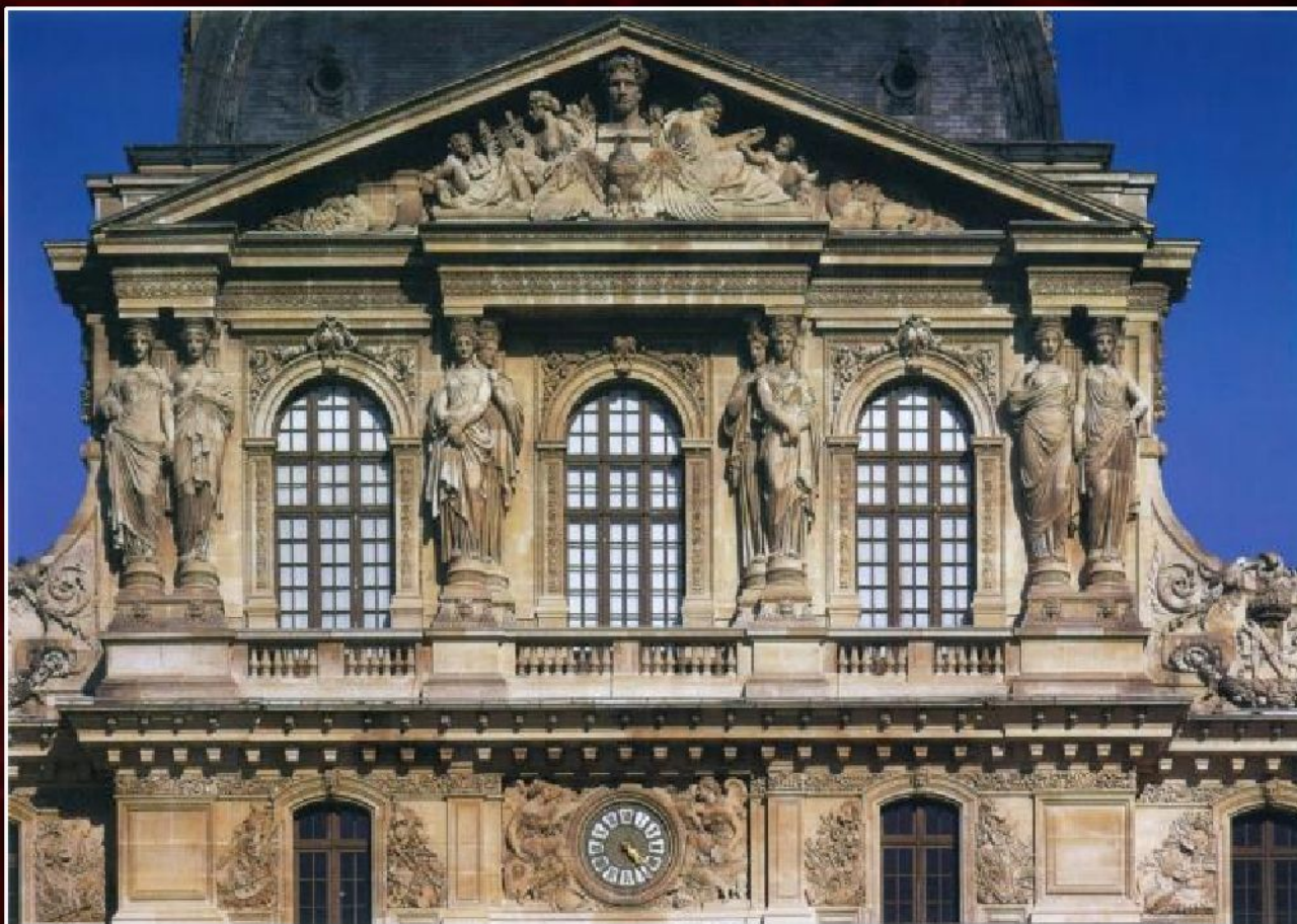
Жак Лемерсье. «Павильон часов» (Париж, Франция), 1624