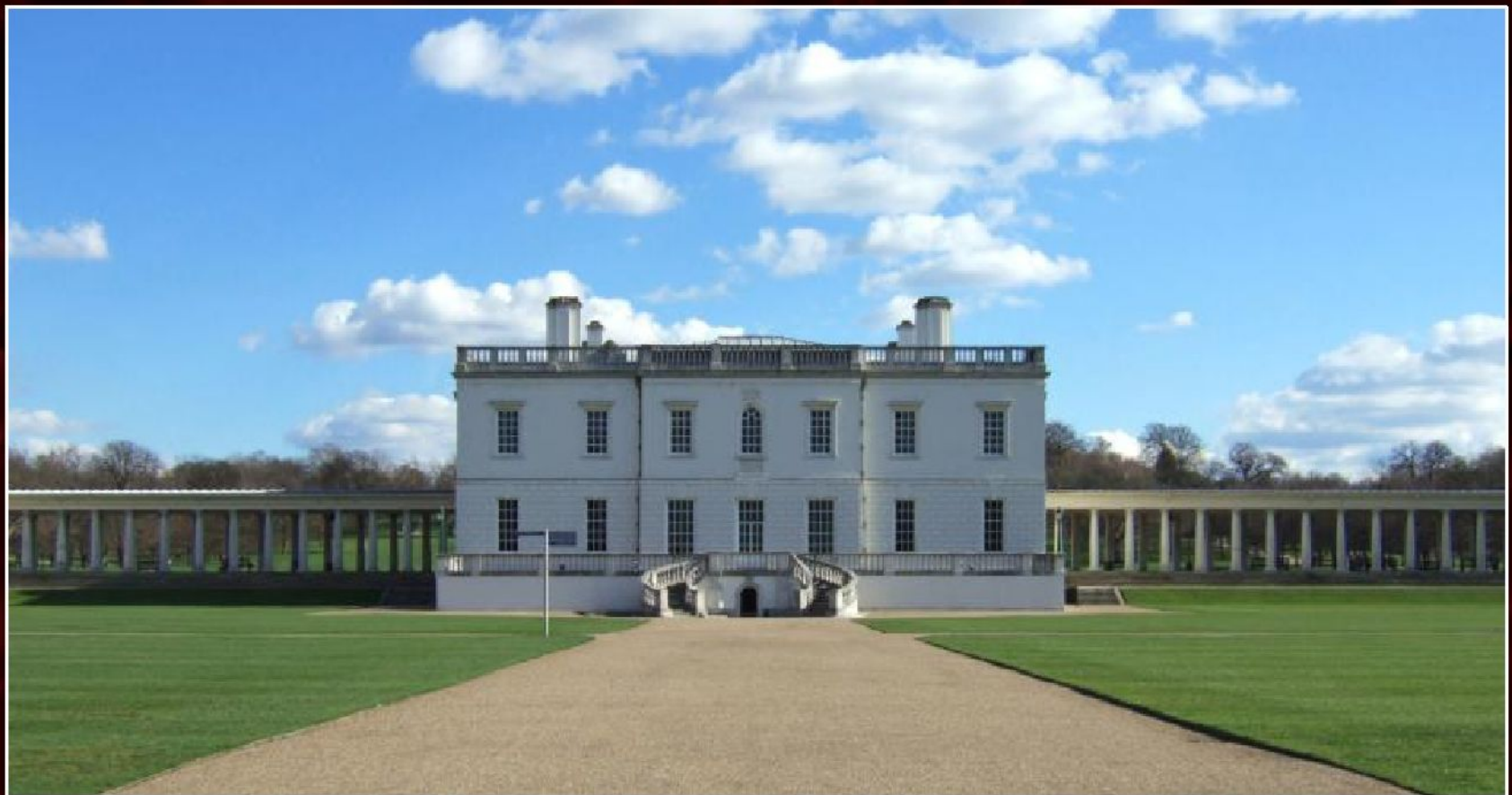
Иниго Джонс. Куинз-хаус (Гринвич, Англия), 1616-1635