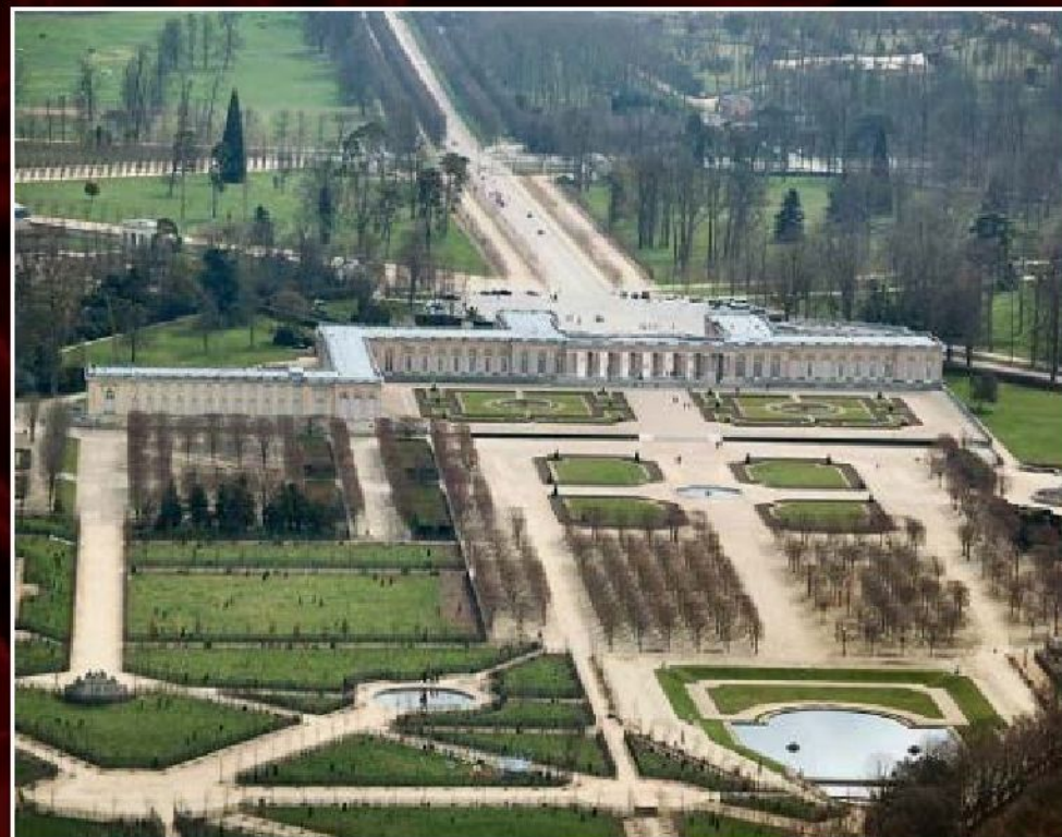
Жюль Ардуэн-Мансар. Большой Трианон в Версальском парке (Франция), 1670-1687