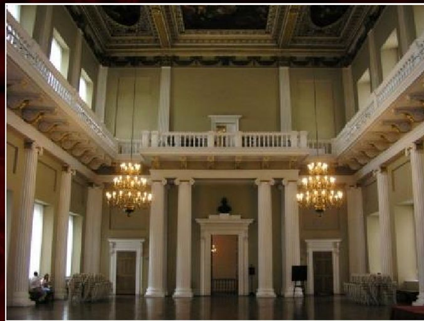
Иниго Джонс. Банкетинг-хаус (Лондон, Англия), 1619-1622