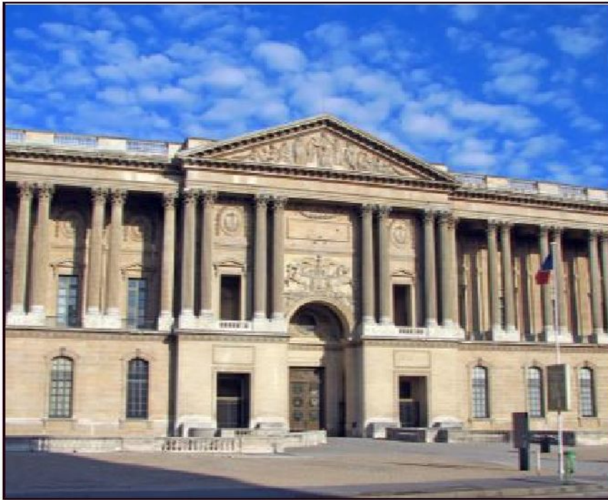
Клод Перро. Восточный фасад Лувра (Париж, Франция), 1667-1674

Ведущая роль в градостроительстве Франции XVII в. принадлежала дворцовым постройкам. Ансамбли дворцов наиболее полно выражали идею неограниченной власти монархов и соответствовали полной роскоши жизни аристократов.