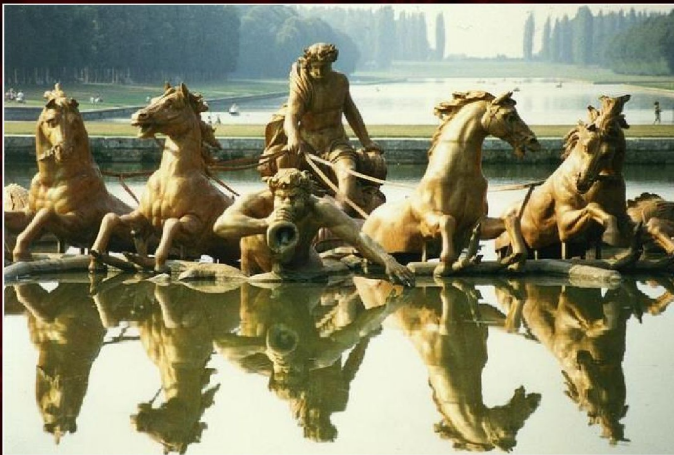
Жан-Батист Тюби «Аполлон на колеснице» (фонтан Аполлона в парке Версаля), 1668-1670