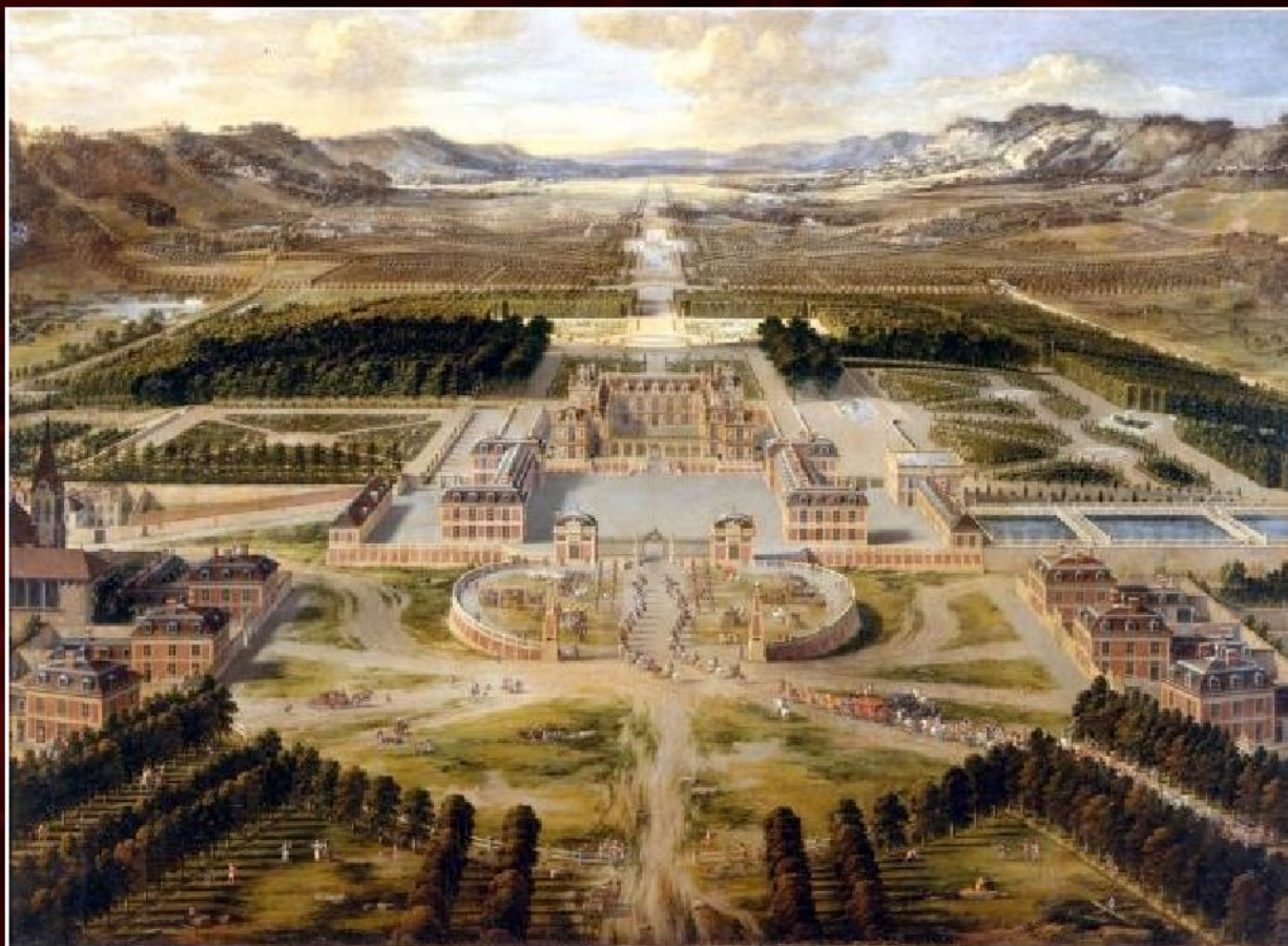
Пьер Патель «Вид с высоты птичьего полета на дворец и сад Версаля», 1668