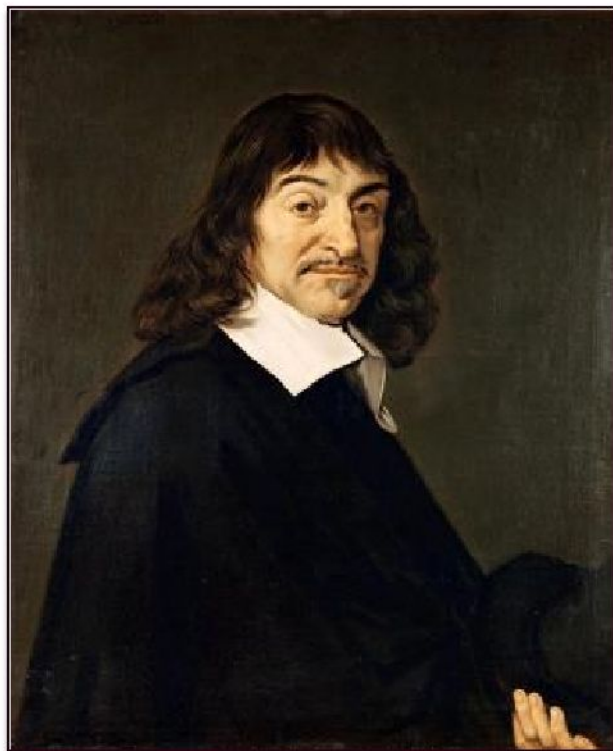
Франс Халс «Портрет Рене Декарта», 1649

В основе классицизма лежат идеи рационализма, нашедшие яркое выражение в философии Декарта (провозгласившего господство человеческого разума).