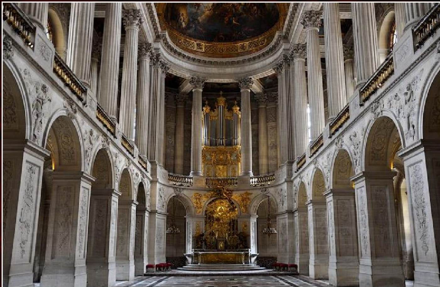
Ж. Ардуэн-Мансар, Робер де Котт. Капелла во дворце Версаля (Франция), 1689-1710