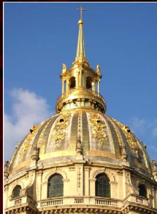
Жюль Ардуэн-Мансар. Собор Дома инвалидов (Париж, Франция), 1680-1706