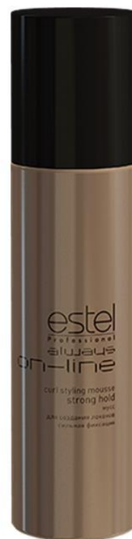
Мусс для создания локонов Estel Always ON-LINE сильная фиксация