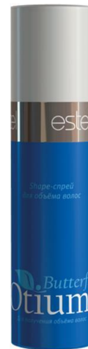
Shape-спрей Otium Butterfly Для объёма волос