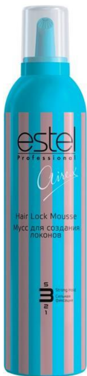
Мусс для создания локонов Сильной фиксации Airex