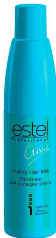
Молочко Для укладки волос Airex