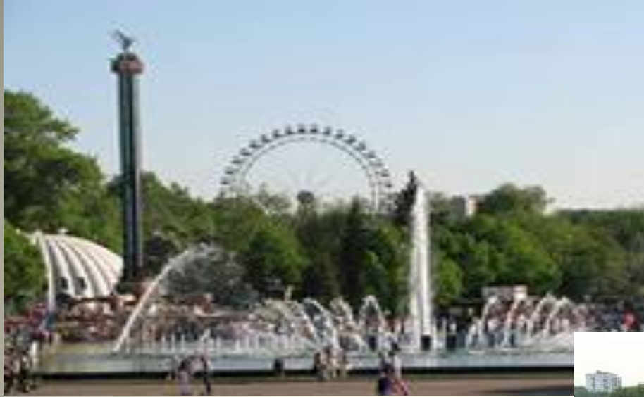
им. Горького Центральный парк