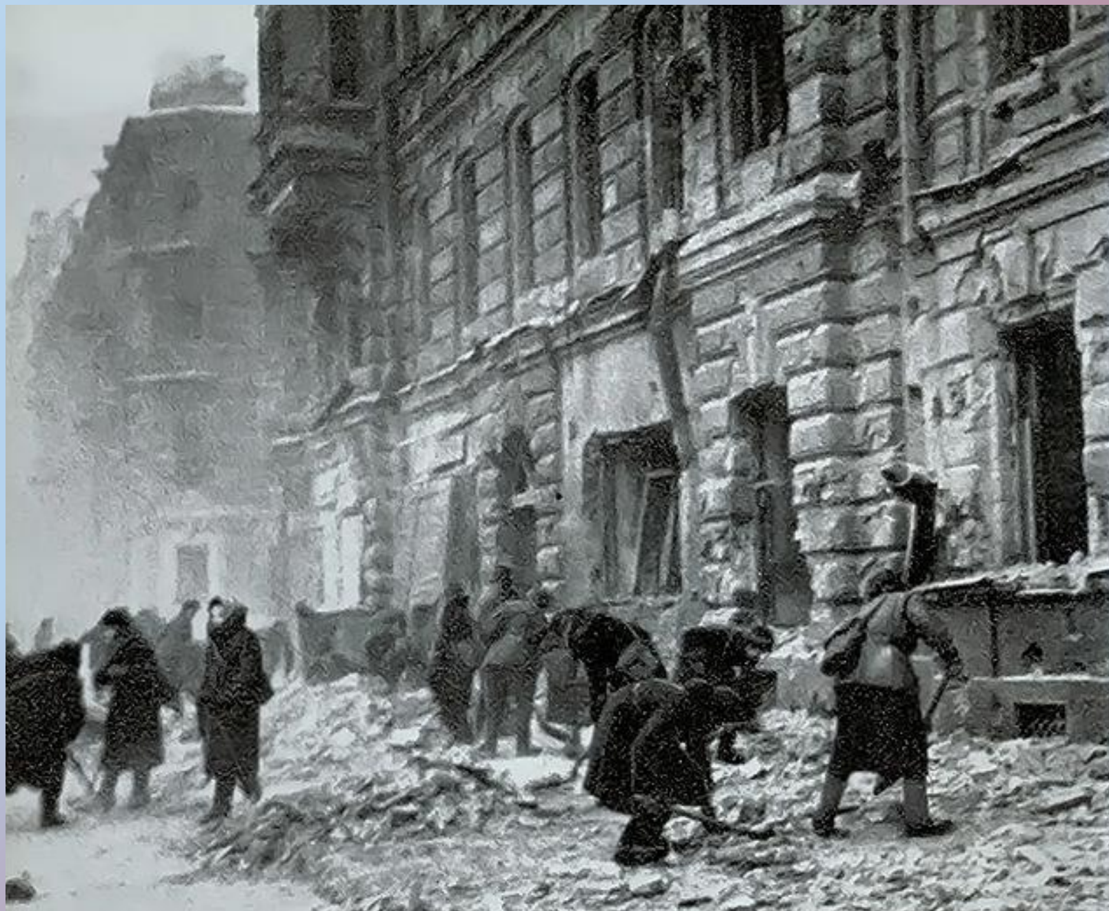
После артиллерийского обстрела. Ноябрь 1941 г.