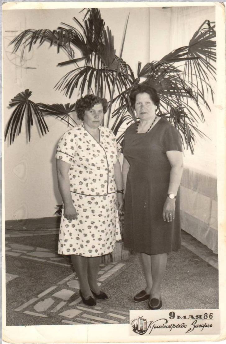
9 мая 86 Красноярские Заряне