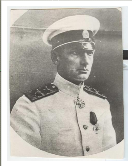
КОЛЧАК АЛЕКСАНДР ВАСИЛЬЕВИЧ