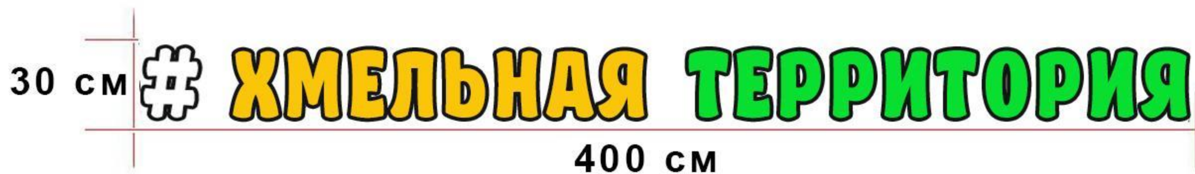
Схема информационно-рекламного оформления здания (фасадная схема)

Адрес: Московская обл., г. Котельники, мкр. Южный, д. 12