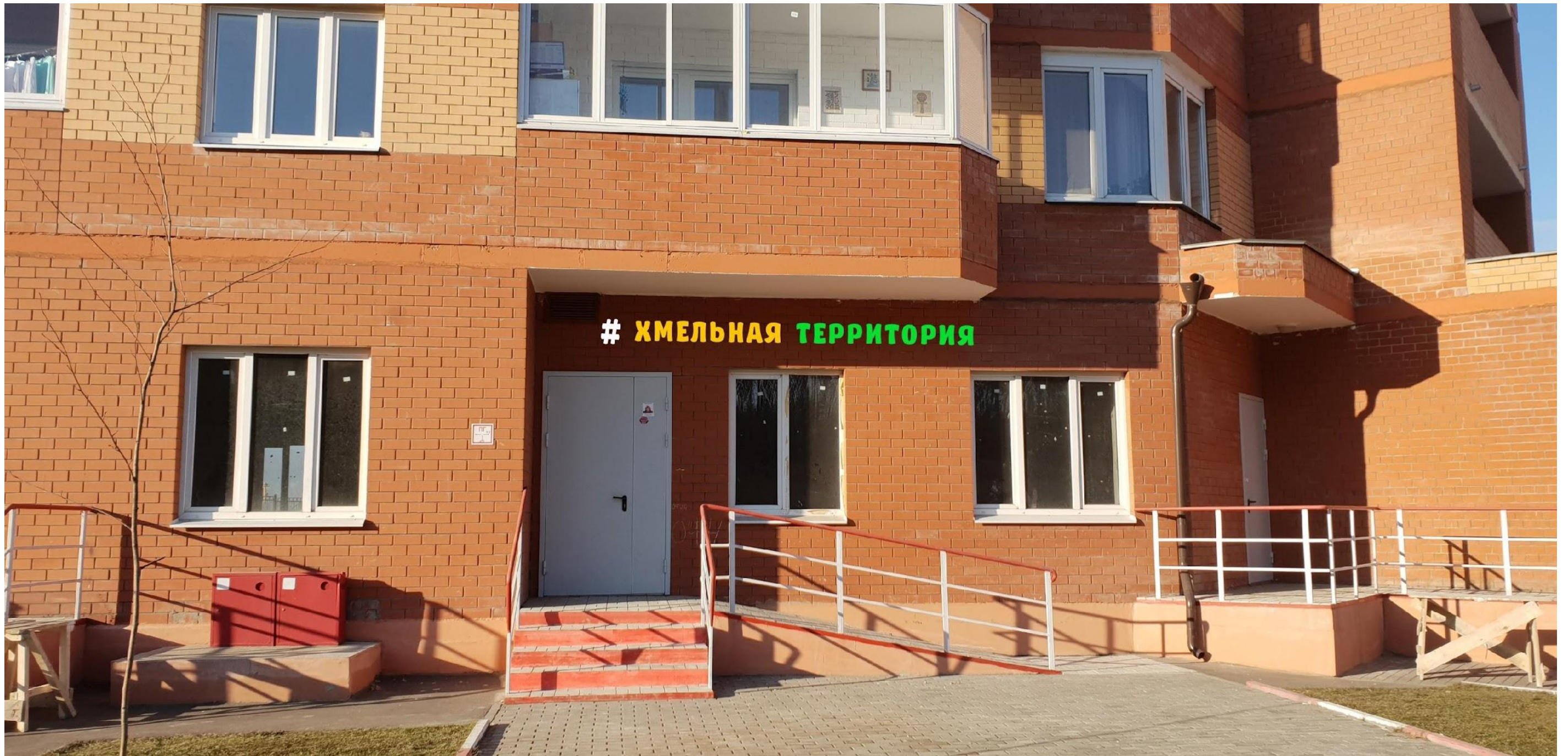
Схема информационно-рекламного оформления здания (фасадная схема)

Адрес: Московская обл.. г. Котельники, мкр. Южный, д. 12