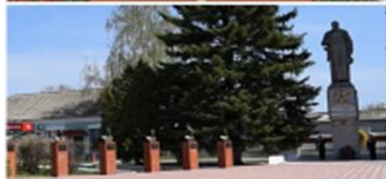
Бюст в посёлке Вешкайма