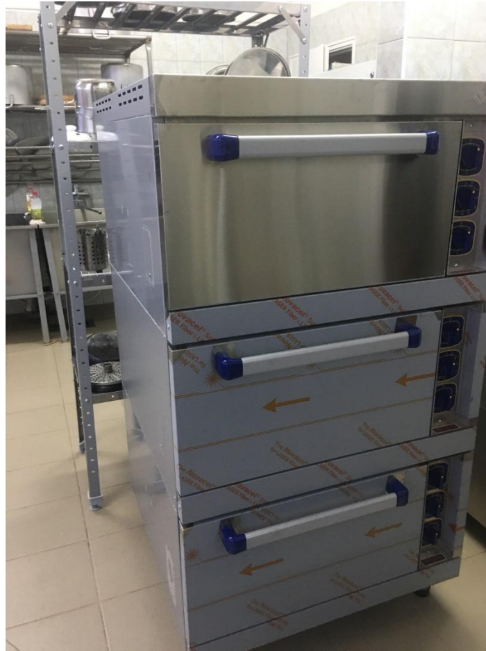
Новый жаровочный шкаф