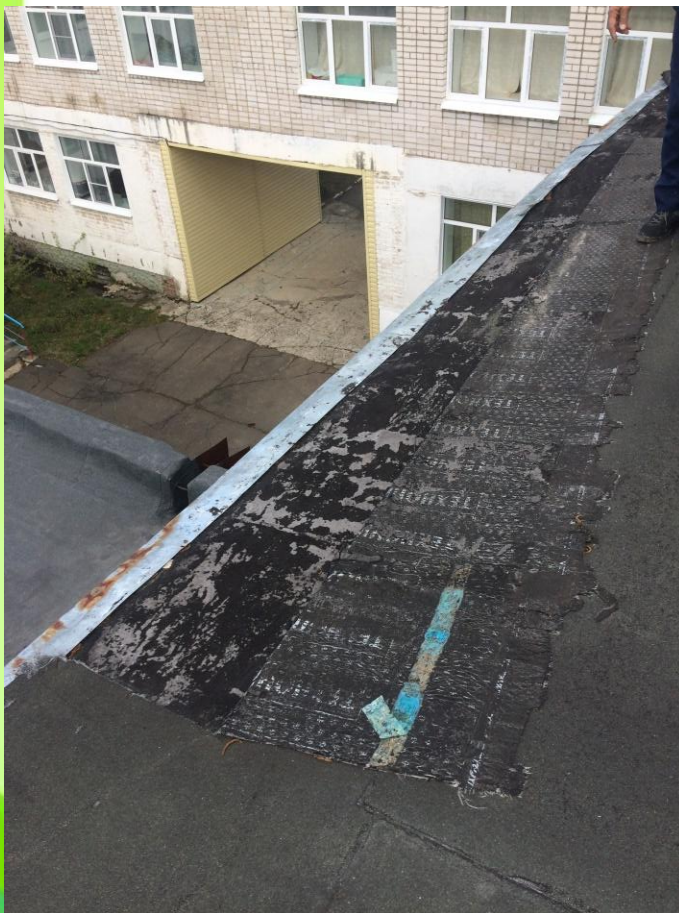
Ремонт кровли 2 корпуса