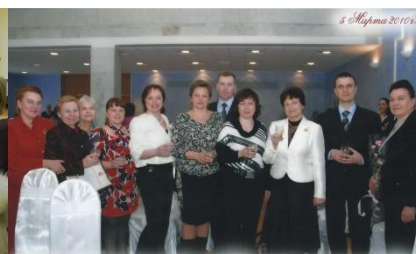
Торжественный приём, посвящённый Международному дню пожилых людей