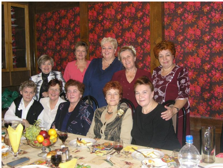
Первый состав президиума