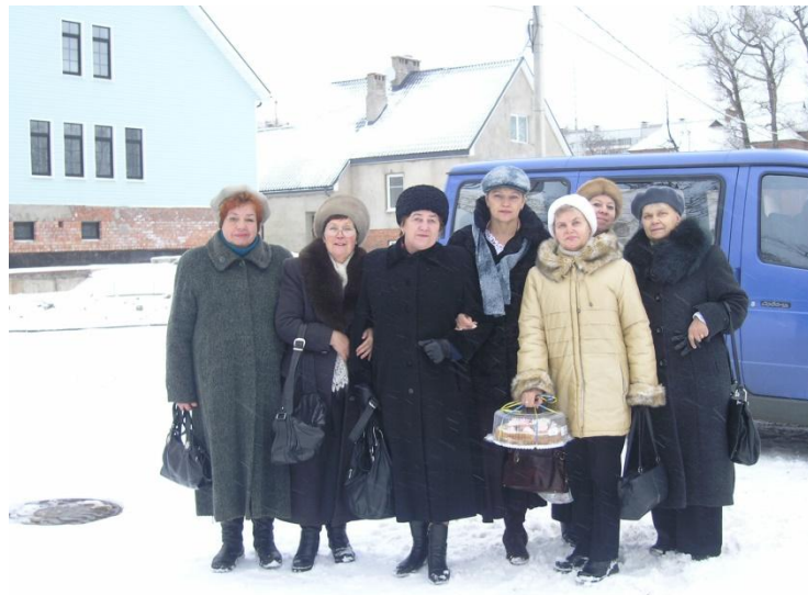
В музей Милютина на встречу с болгарской делегацией