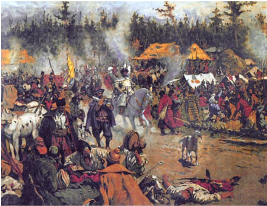
С.В. Иванов. "В смутное время"