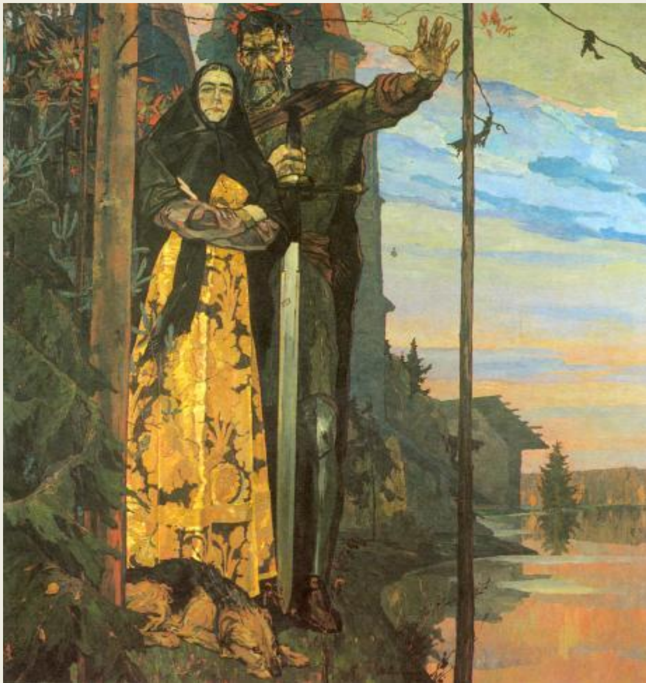
А . Корин «Александр Невский».