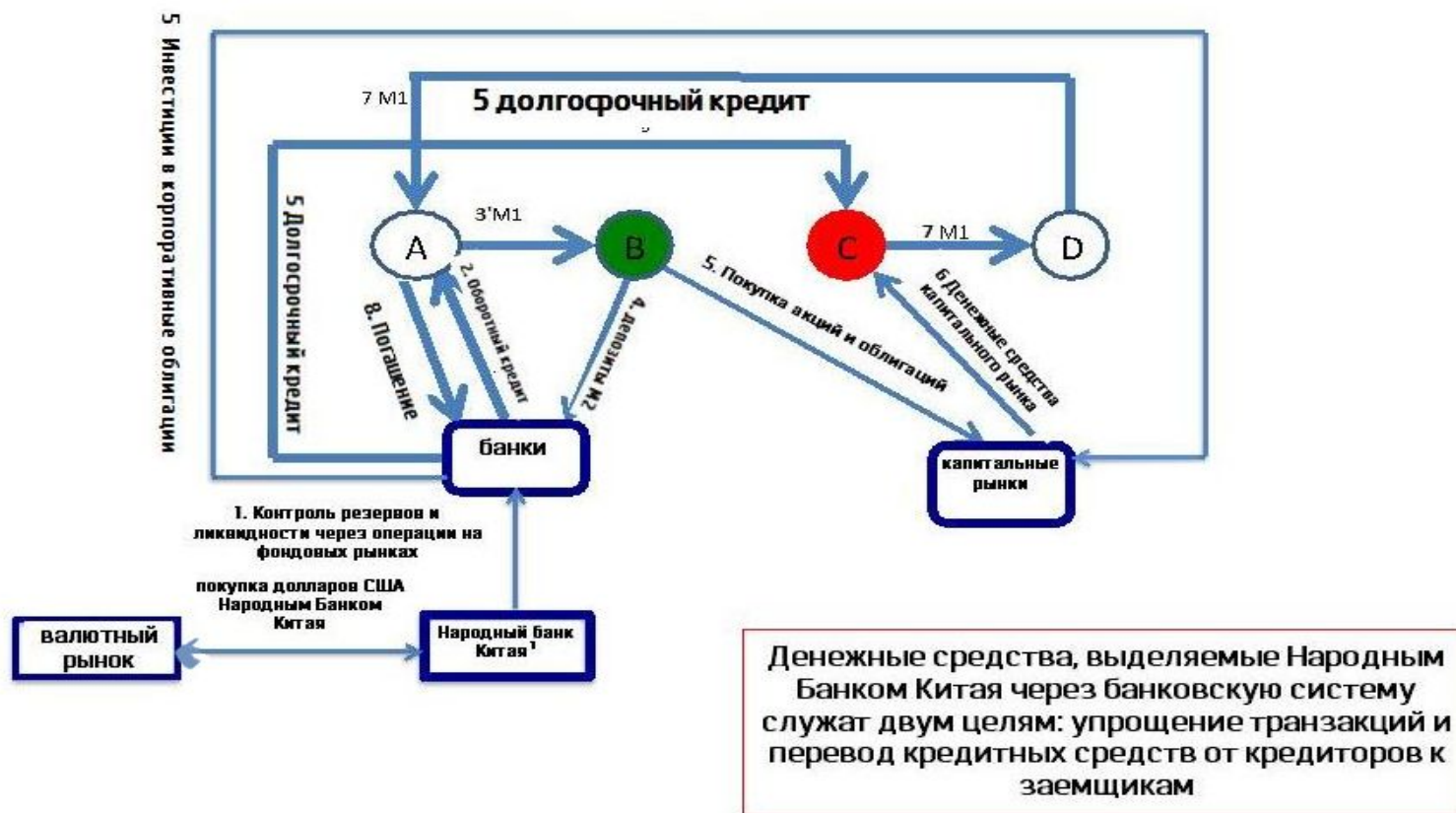
Схема организации денежного предложения в экономике