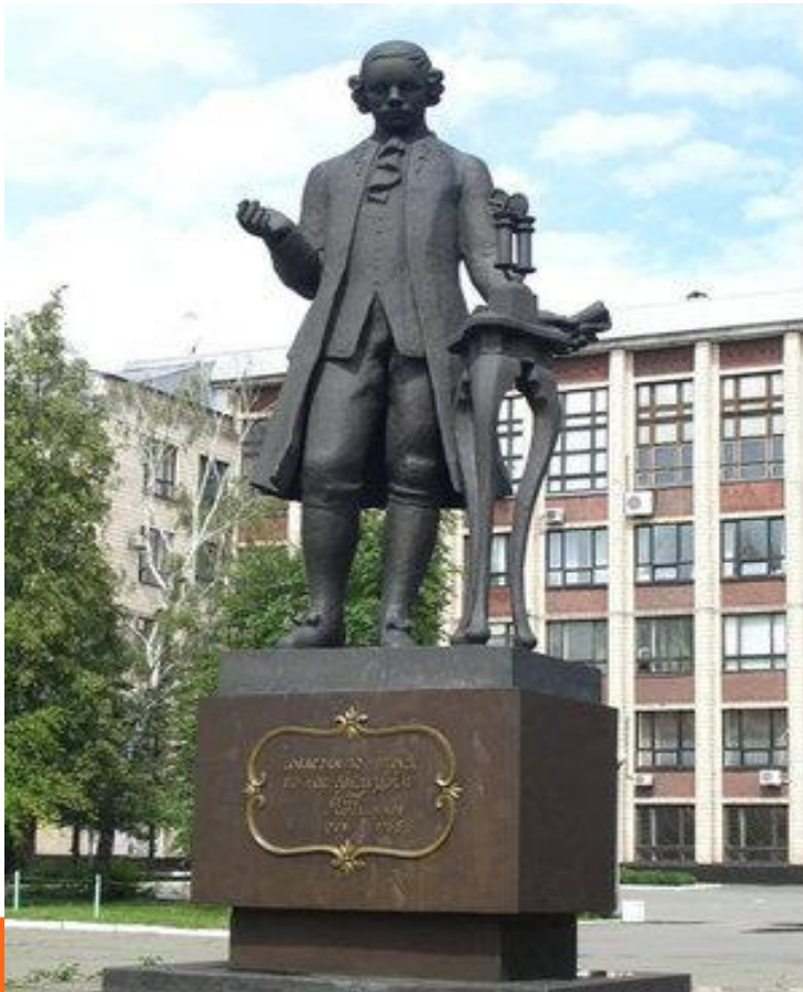
Памятник И.И. Ползунову в г.Барнауле