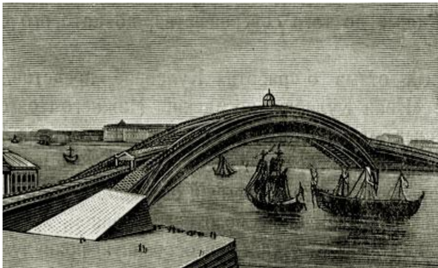
Проект деревянного моста через р.Неву