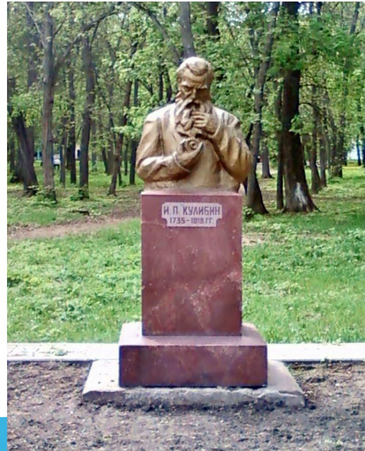
Памятник И.П.Кулибину в Нижнем Новгороде