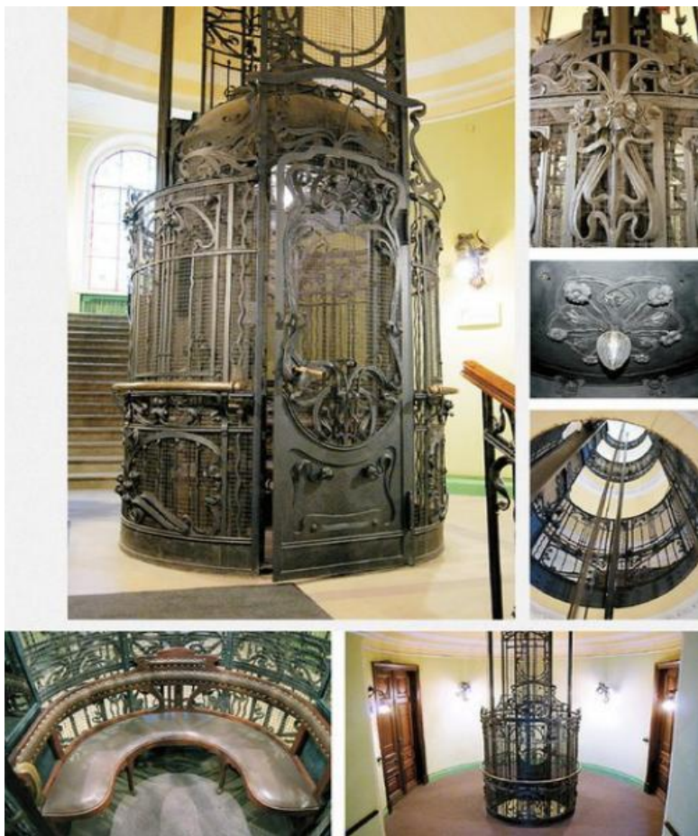
Лифт для дворца императрицы