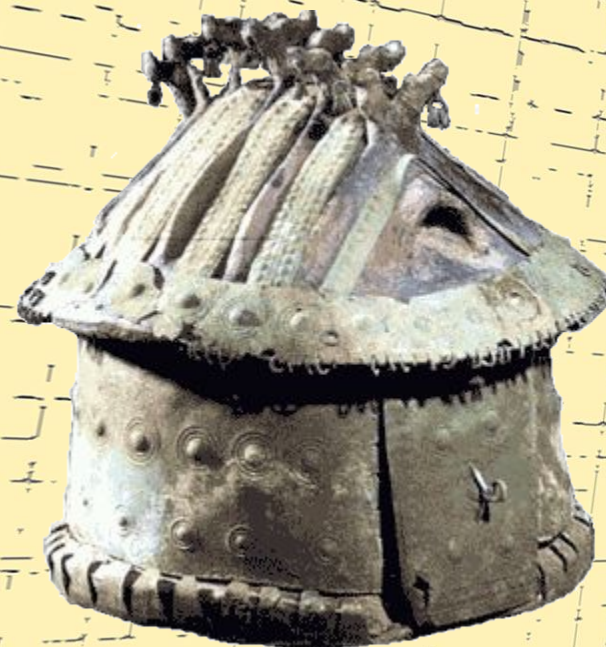
Урна в виде жилища для пепла умершего