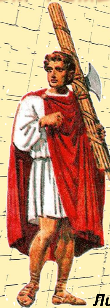
Ликтор (охранник и палач)