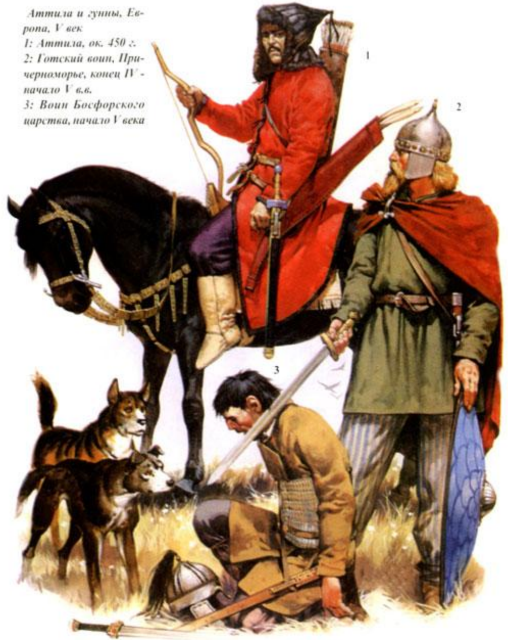
Аттила и гунны, Европа, V век 1: Аттила, ок. 450 г. 2: Готский воин, Причерноморье, конец IV - начало V в.в. 3: Воин Босфорского царства, начало V века

452 г вторжение Аттилы в Италию и угроза Риму. Почему гунны не захватили и не разграбили данный город?