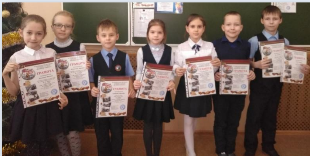
Муниципальный фестиваль «Созвездие талантов» для учащихся 1-4-х классов «Великая Победа!»