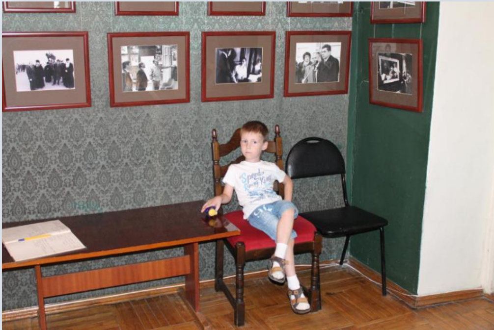
Музей одной картины (г. Пенза). Вус Артем. Июль, 2018 г.