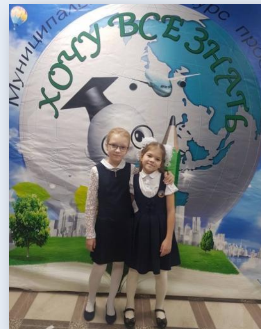
Муниципальный конкурс проектов «Хочу всё знать!»