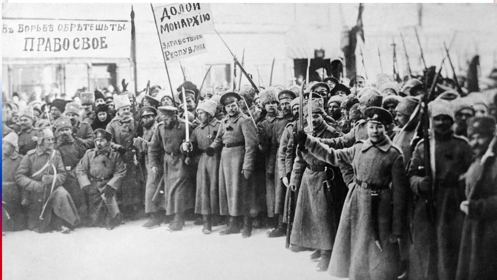
Революция в Крыму