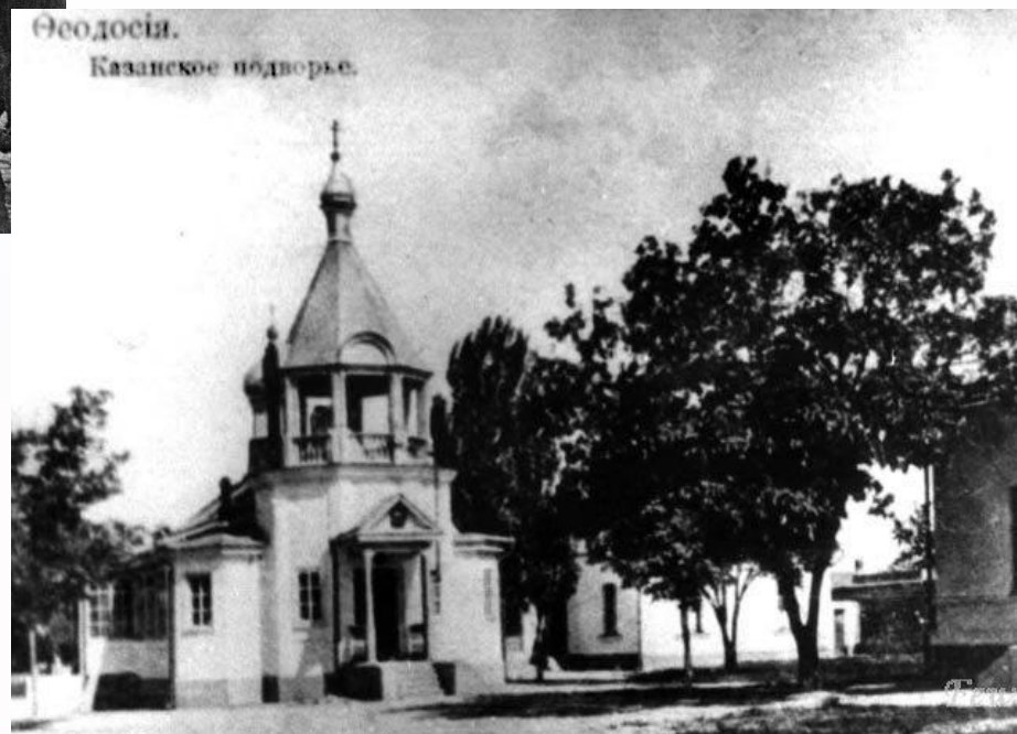
Феодосия 20 век