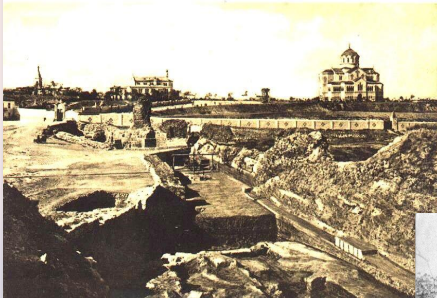
Севастополь 20 век