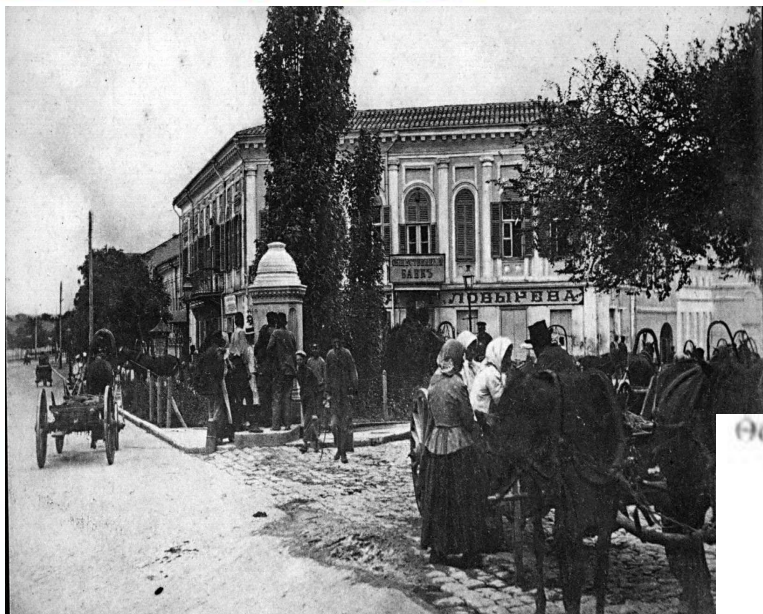
Керчь 20 век