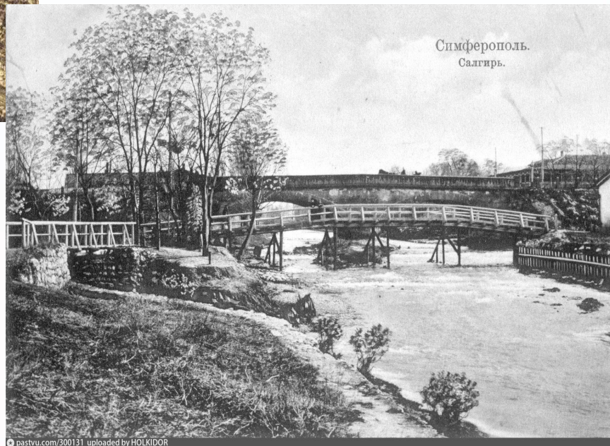
Симферополь 20 век