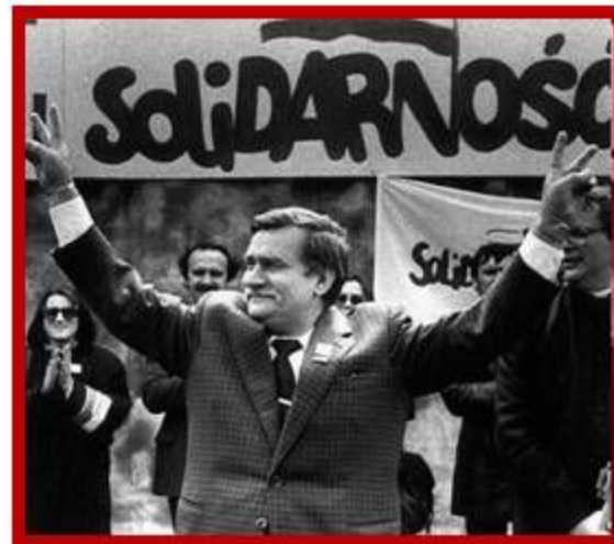
Лех Валенса – лидер «Солидарности»

1980—1981 гг. - в массовое демократическое рабочее движение в Польше, представители которого объединились вокруг независимого профсоюза « Солидарность ». Против КПСС выступили миллионы рабочих. Лидеры СССР не решились ввести войска в Польшу. Они ограничились экономической помощью и советами лидерам польских коммунистов и Председателю Государственного совета Польши В. Ярузельскому о том, как нормализовать положение. В конечном итоге усилиями польской армии в стране было введено военное положение, а лидеры оппозиции подверглись аресту.