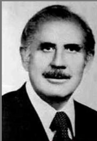
Нур Мухаммед Тараки

В марте 1978 года в Афганистане к власти пришла группа офицеров во главе с Тараки.