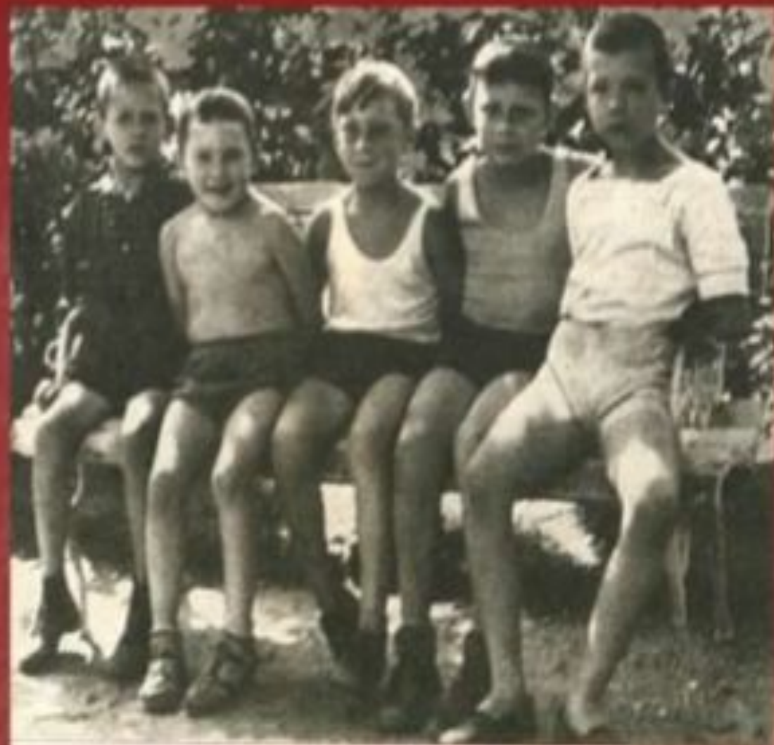
Германия 1948 год.