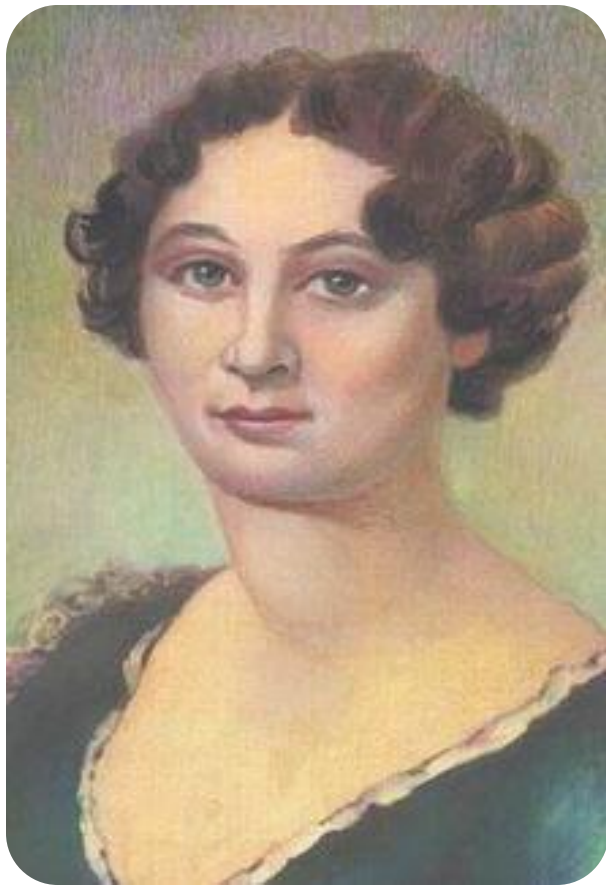
Варвара Петровна Лутовинова мать писателя

Ей было уже под 30, когда в Спасское заехал молодой офицер Сергей Николаевич Тургенев... Варвара Петровна сразу в него влюбилась: отличался он редкостной красотой... В 1816 году она вышла за него замуж, фактически купила, так как Тургеневу грозило разорение. Через год у них родился сын Николай, затем Иван. Мать И. Тургенева была властной, суровой женщиной. Сын её любил, но боялся гнева и грозных наказаний .