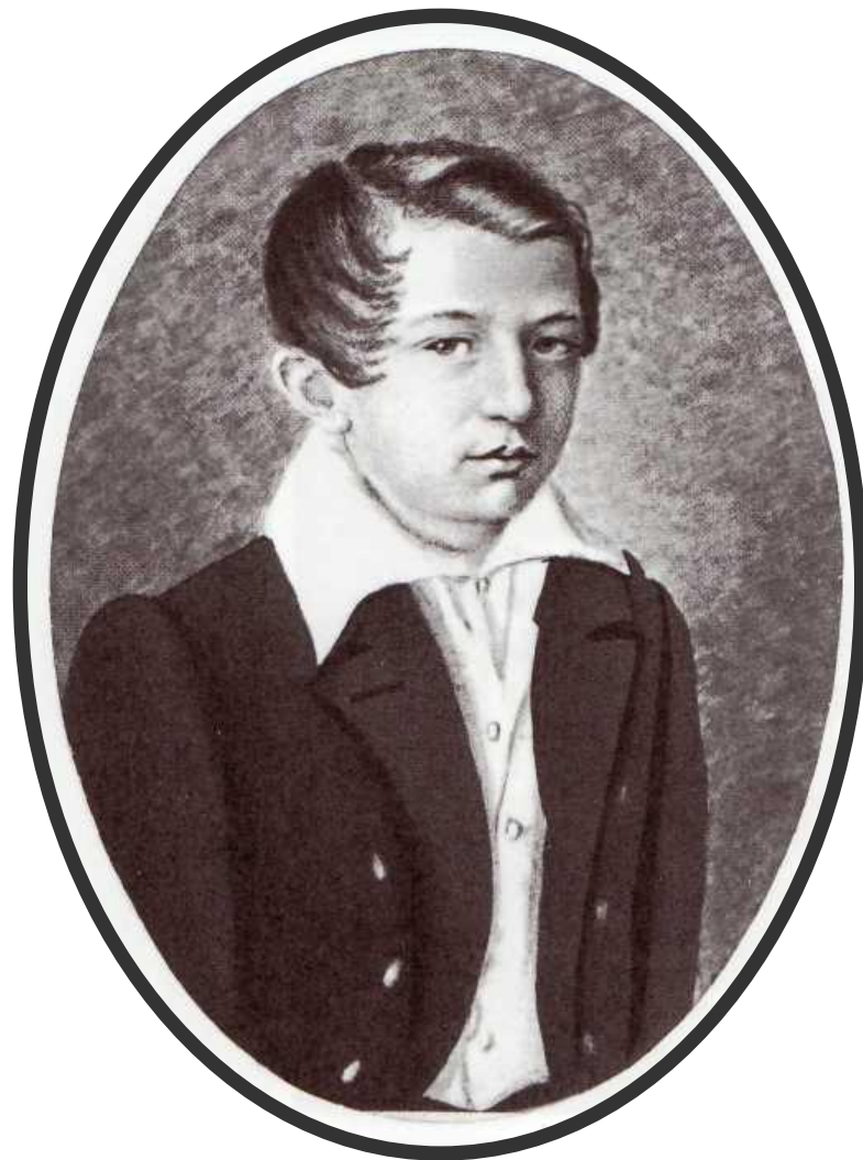
И.С. Тургенев. Портрет 1830г. Акварель

«Мне нечем помянуть моего детства. Ни одного светлого воспоминания. Матери я боялся, как огня. Меня наказывали за всякий пустяк, одним словом, муштровали, как рекрута. Редкий день проходил без розог; когда я отваживался спросить, за что меня наказывали, мать категорически заявляла: «Тебе об этом лучше знать, догадайся»»