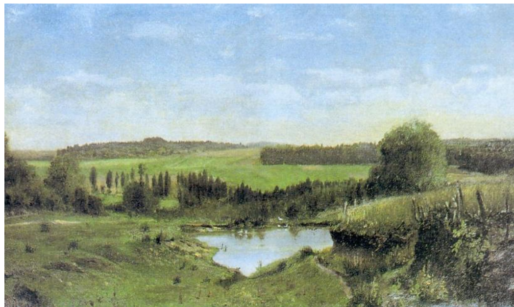
Спасское-Лутовиново. Поповский пруд. 1881 Я.П. Полонский.

За домом сад с роскошными цветниками, с тёмными тенистыми аллеями спускается к прудам.