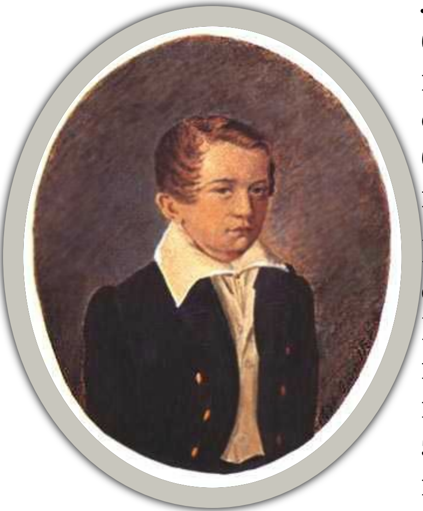
Иван Тургенев 12 лет

Любимчик Ванечка стал беспокоить матушку с раннего возраста. И добр, и ласков, но уж очень прост и правдив до бесхитростности: что на уме, то и на языке.