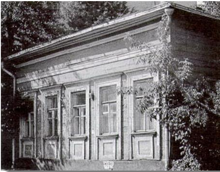
Пансион И. Ф. Вейденгаммера