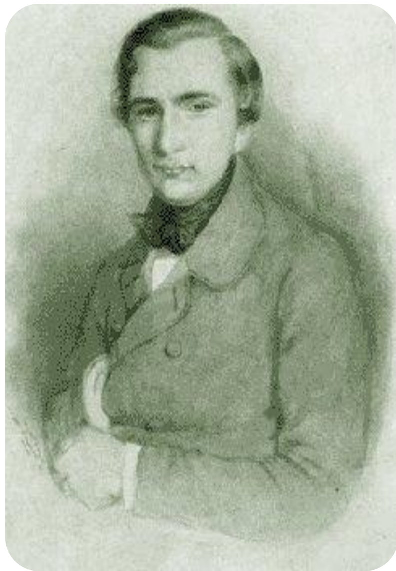
Иван Тургенев 1838-1839

С 1839 г. И.С. Тургенев живет в Берлине, слушает лекции в университете, занимается классическими языками, пишет стихи