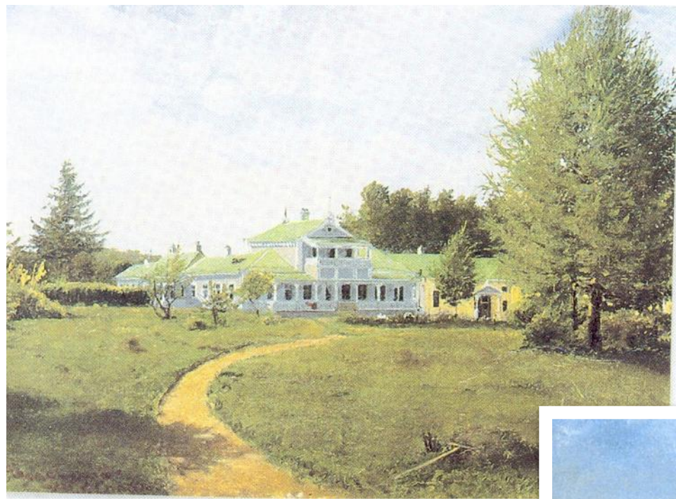
Усадебный дом И.С. Тургенева. 1881 Я.П. Полонский.