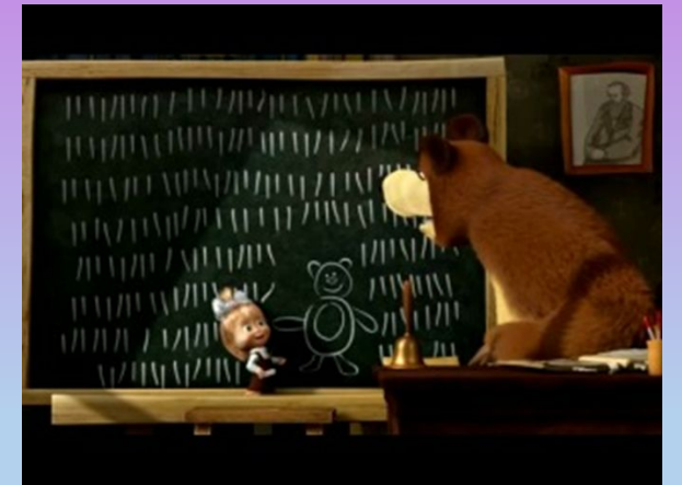
Estudiar en la escuela