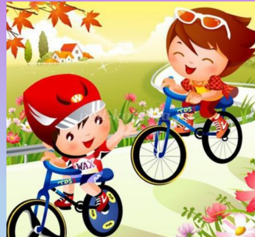
Montar la bici