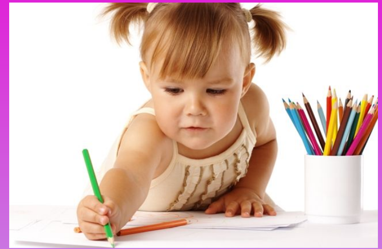
Dibujar a la familia